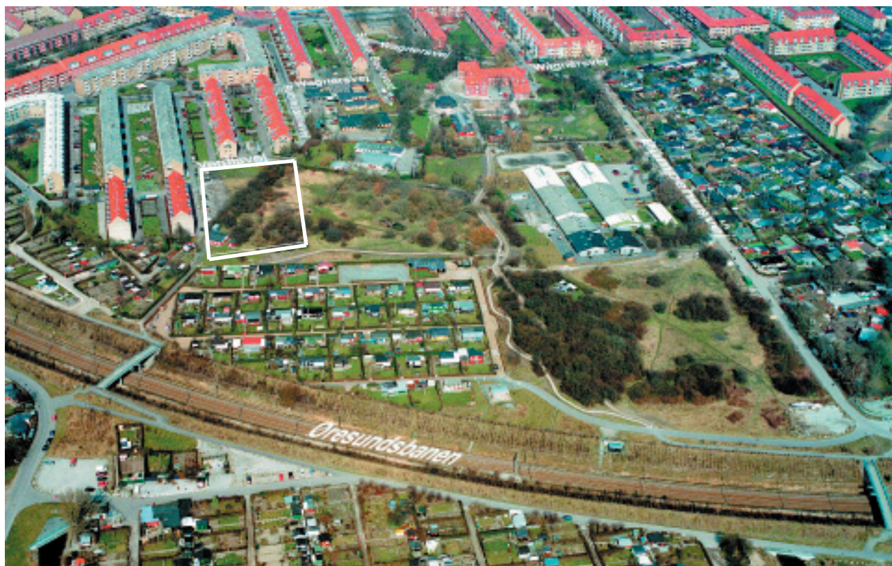
Luftfoto af området set fra syd med byggefeltet markeret

Ud af flere bud blev tilbudet fra Boligselskabet Kærbo v/ Domea s.m.b.a., som var højstbydende, valgt. Bebyggelsen blev foreslået udført som en E-form, hvilket bedømmelsesudvalget anså for at være positivt. Borgerrepræsentationen tiltrådte salget den 14. juni 2006 (BR 385/06), og grunden er overdraget den 1. juli 2006. Det bilagte projekt til skema A har imidlertid igen F-formen. Tegnestuen Arkitema,