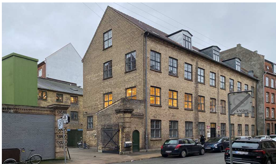
Forhuset (Hannovergade 8) i forgrunden og baghuset (Hannovergade 8B) i baggrunden.

Bygningen er præget af den sene historicisme med en enkel harmonisk facade med få detaljer, der afspejler den industribygning, det har været, dog med et karakterfuldt og fint formet buemotiv midt i stueetagen fra udvidelsen i 1896, oprindeligt som indgang til et indre portrum. Oprindeligt havde bygningen her også en gavlkvist, hvor der i 1926 blev etableret en udvendig åben vareelevat. Den er i dag nedtaget, inklusive gavlkvisten, for en nyere elevator opført i 1997 på den anden side af buemotivet som en tilbygning uden på facaden med en lukket pladebeklædning, og fremstår i dag dominerende og som et fremmedlegeme på den ellers harmoniske facade.