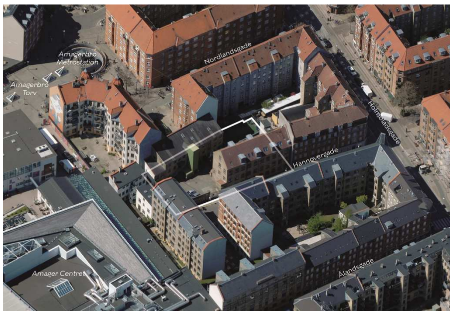
Området set mod vest. Lokalplanområdet er indtegnat med hvid linje, og de vigtigste gader, pladser og bygninger er navngivet.

Området omfatter ejendommen Hannovergade 8, matr.nr. 33f, Sundbyøster, København. På ejendommen er der et baghus, Hannovergade 8, opført i 1894, og et forhus, Hannovergade 8, opført i 1918. Begge bygninger er tidligere fabriksbygninger.