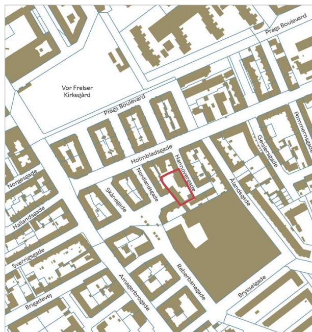
Kort fra 2024. Boligkarréerne har omsluttet den sidste rest af industrikvarteret. Lokalplanområdet er indtegnet med rødt.