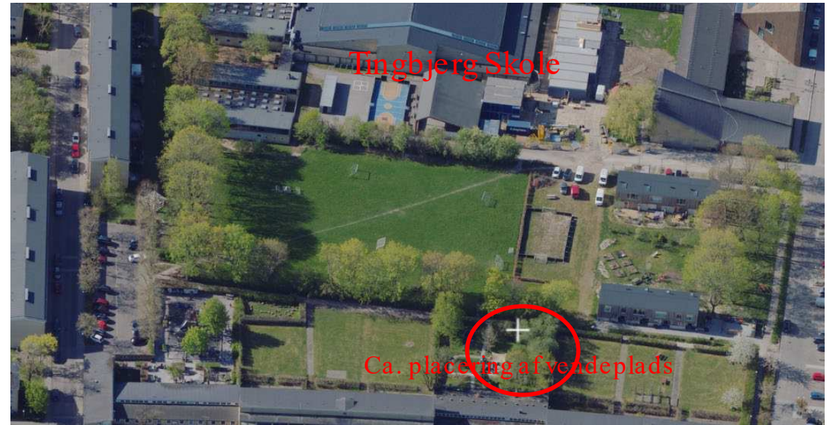
Luftfoto af området set fra nord