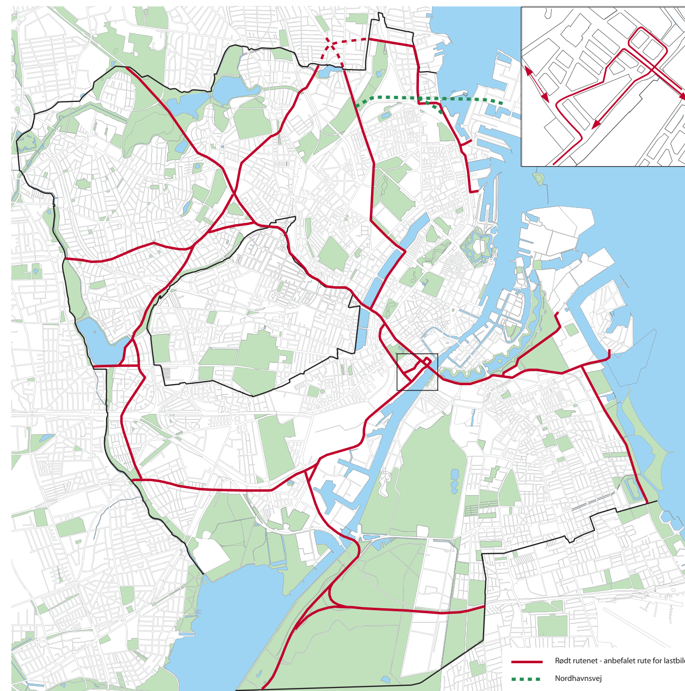
Det anbefalede rutenet for lastbiler - fuldt implementeret