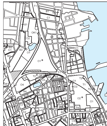
Forslag til rammeændringer (vist med skravering). O1-området øst for Helsingørmtorvejen, O1*-området ved Svanemøllens Kaserne, B1 og T1 områderne ved Strandvænget, reduceres for at give plads til vejlægget.