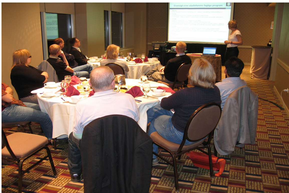
Ankommet til Hotel Embassy Suites i Chicago mandag den 6. april 2008. Middag og gennemgang af studieturens program.