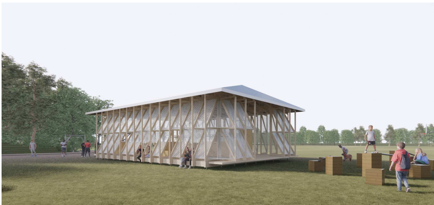
Visualisering af pavillon 150m2 fra projekt på Fyn