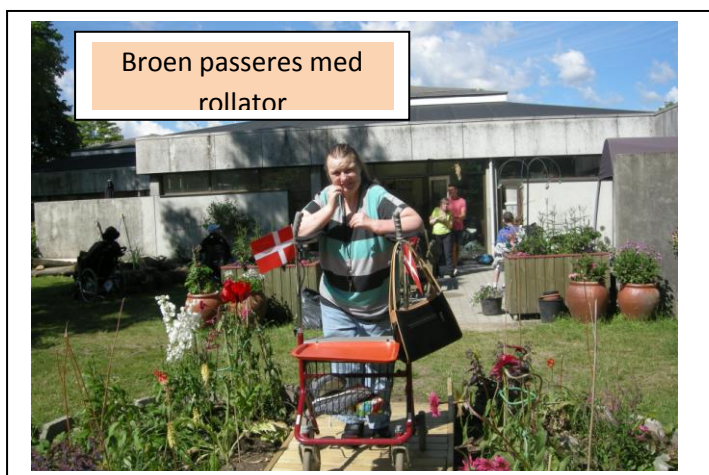
Broen passeres med rollator

Pengene blev bevilliget til anlæg af havebassin, rum i haven og sansesti . Vi har ved hjælp af disse midler anlagt en lille sø med springvand, bygget en bro igennem et staudebed og anlagt en frugthave.