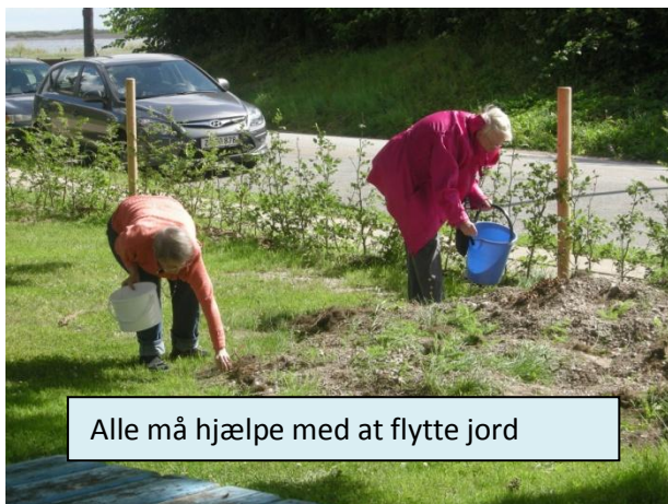
Alle må hjælpe med at flytte jord