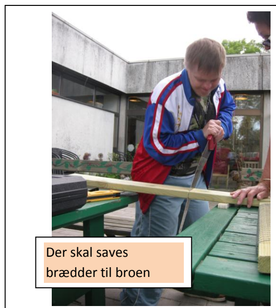
Der skal saves brædder til broen