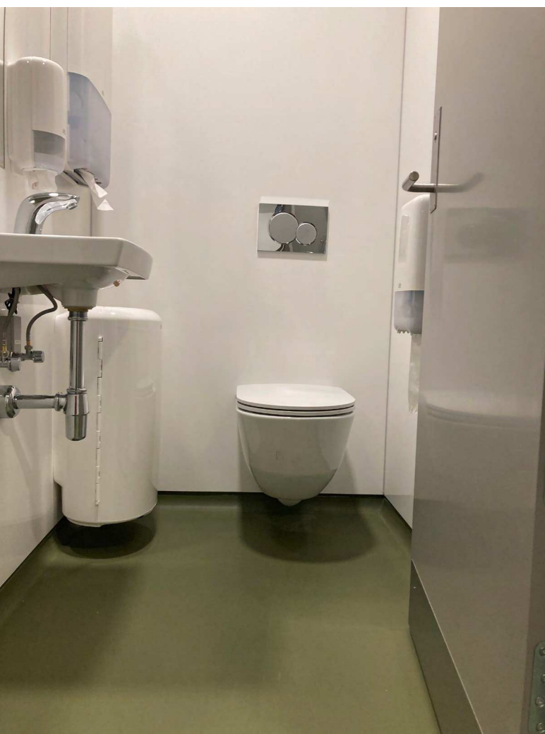
Gulvbelægning med afsluttet gulv med hulkele. Toilettet og øvrigt inventar er væghængt for også at lette rengøringen

Toiletrummetts vægge, gulve, lofter, døre og låse har stor betydning for elevernes oplevelse af deres toiletbesøg. En god oplevelse af rummet kan være med til at mindske de mentale barrierer, der kan være forbundet med toiletbesøg. Farver og god belysning kan dertil forbedre brugeroplevelsen og understøtte hensigtsmæssig adfærd hos eleverne. Materialer og overflader bør samtidigt vælges med tanke på rengøring og robusthed.