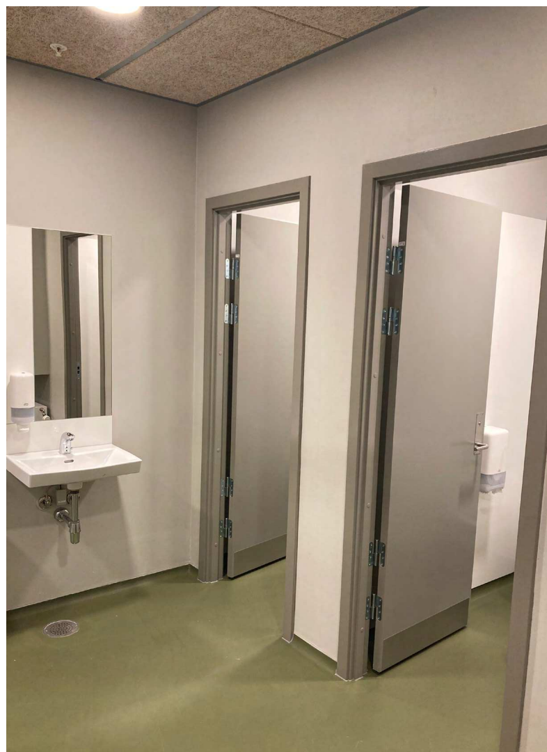
Et eksempel på et godt oplyst forrum i farver.