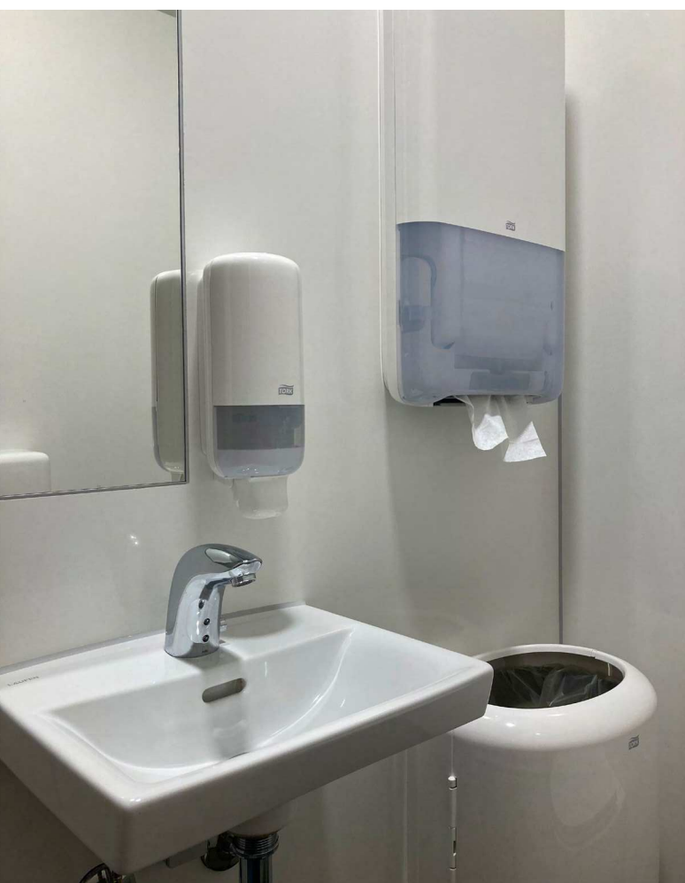
Spejl er smallere end håndvaskens bredde. På den måde sikres korrekt placering af sæbedispenser.

Toilettets inventar skal placeres hensigtsmæssigt med tanke på optimal adfærd og brug. Det gælder om at dryppe mindst muligt på gulvet efter at have vasket hænder, så oplevelsen af renhed sikres bedst muligt. Dertil skal inventar så vidt muligt væghænges, da det letter den daglige rengøring.