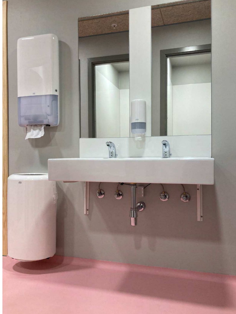
Her ses korrekt placering af inventar. Sæbedispenseren er placeret over vasken. Papirhåndklæder er placeret tæt ved vasken og over skraldespanden.