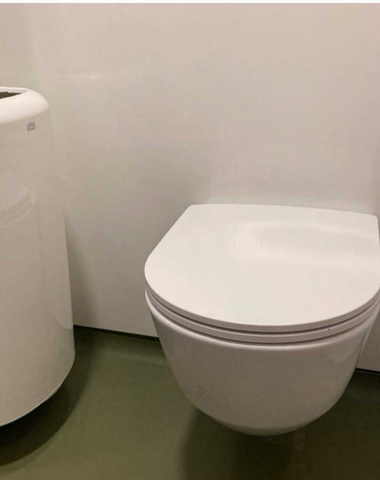
Et væghængt toilet minimerer rengøringsflader og rengøring af gulvet lettes.

Toilettets tekniske installationer bør udvælges med fokus på kvalitet, robusthed og med hensyn til teknisk drift. Rørføringer og tekniske installationer etableres så vidt muligt skjult, så ansamling af snavs og støv reduceres. I målet om let rengøring skal teknikken dog ikke skjules i en grad, som forhindrer gode vilkår for den tekniske drift.