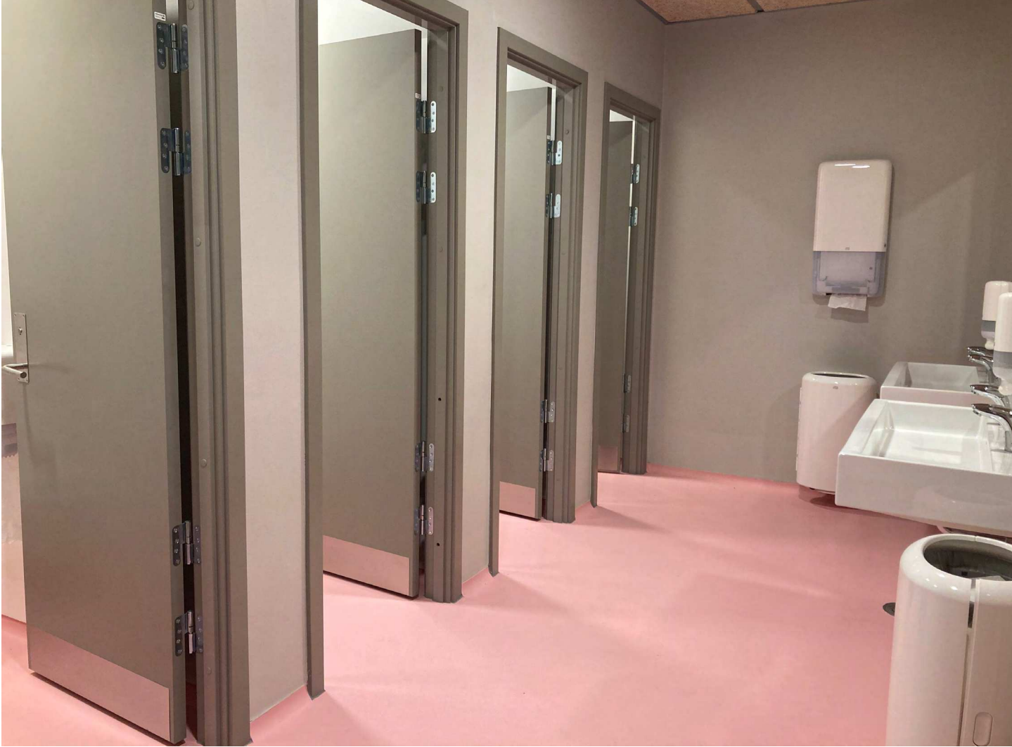
Stort forrum indrettet med håndvaske og med 4 toiletrum på stribе.

Skolernes toiletter bliver brugt af mange elever i løbet af dagen. Derfor er det vigtigt, at toiletterne er placeret tæt på elevernes primære opholdsområder, så alle elever kan nå at komme på toilettet, når de har behov for det. Der til kan toiletter med forrum skabe et godt flow af elever, så tiden på toilettet optimeres.