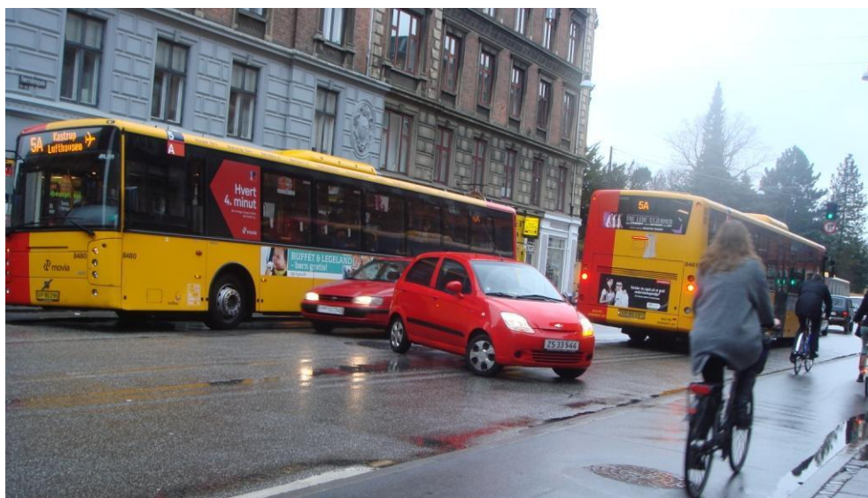
Figur 5.7: Venstresvingende bilist drejer ind mod Møllegade, mens ligeud kørende kører udenom den holdende bus