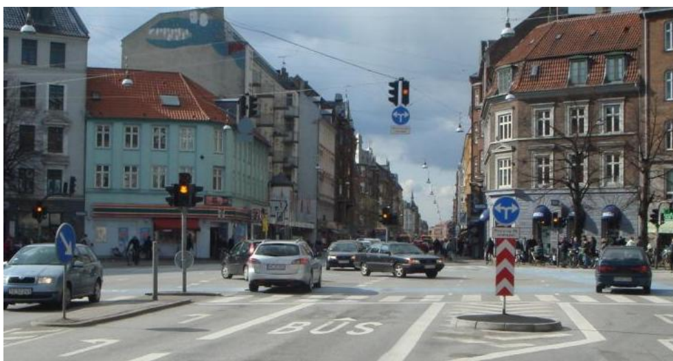
Figur 5.5: Venstresvingende biler, som venter langt fremme i krydset, og dermed spærrer busbanen.

En anden observation er, at nogle venstresvingende fra Ydre Nørrebro kører forholdsvis langt frem i krydset og venter dermed kun på modkørende cyklister og gående. Det kan give potentielle konflikter med ligeudkørende busser fra Indre Nørrebro eller eventuelle ulovligt ligeudkørende biler, se Figur 5.5.