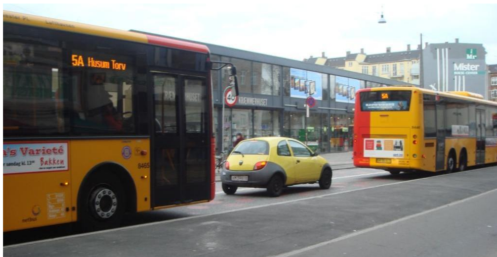
Figur 5.1: Bil mellem busserne forhindrer den bagerste bus i at komme frem til stoppestedet ved perronen.