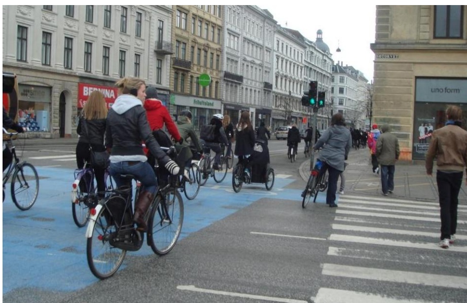
Figur 5.8: Cyklist, som viser af mod stiforbindelsen til Vendersgade.

Observationerne af cyklister fra broen, gennem krydset og mod Vendersgade illustrerer, at mange rækker hånden ud og viser af, når de er halvvejs gennem krydset, se Figur 5.8.