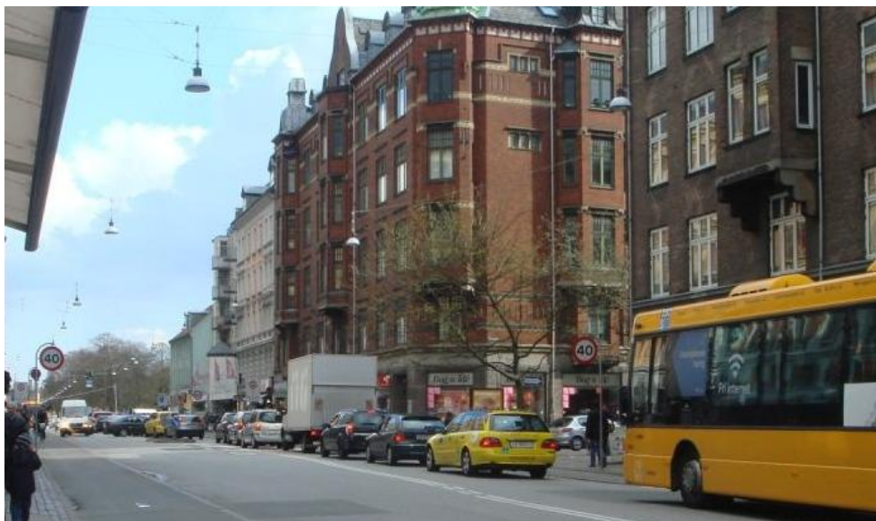
Figur 5.4: Eksempel på bus, som ikke kan komme frem til busbanen for venstresvingende biler mod Jagtvej fra Ydre Nørrebro