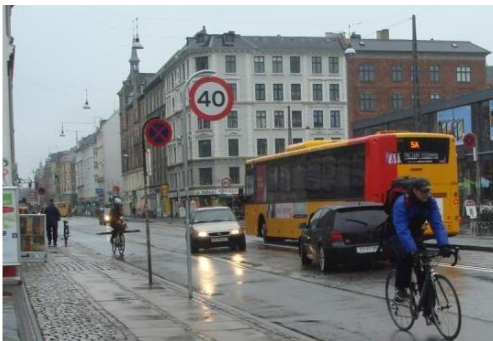
Figur 5.2: Konflikt mellem bil som forsøger at overhale en bus ved stoppestedet og modkørende trafikant.

De overhalende biler kan føre til sikkerhedsmæssige problemer. For det første er der en tendens til, at de overhalende biler accelererer hurtigt, og for det andet opstår problemer og konflikter både for krydsende fodgængere og bilister til/fra Bragesgade, som ikke forventer biler i den forkerte side af vejen, se Figur 5.2.