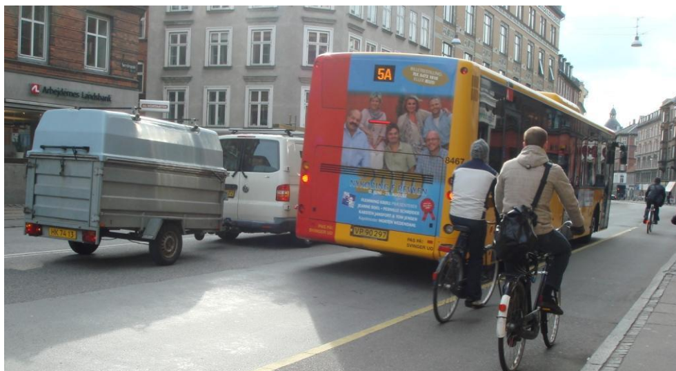
Figur 5.6: Bus holder ved stoppested, mens der holder venstresvingende biler og venter på at dreje ind på Møllegade

Observationerne viser, at busserne ikke har problemer med at komme ind og ud fra stoppestedet ved Møllegade. Bussen kan holde parallelt med eventuelle venstresvingende biler, se Figur 5.6. Busstoppet ligger ved kantstenen, men der er plads til, at en bil kan køre udenom eller holde og vente på venstresving mod Møllegade. Der kan holde to busser ved stoppestedet, og buspassagererne venter på fortovet.