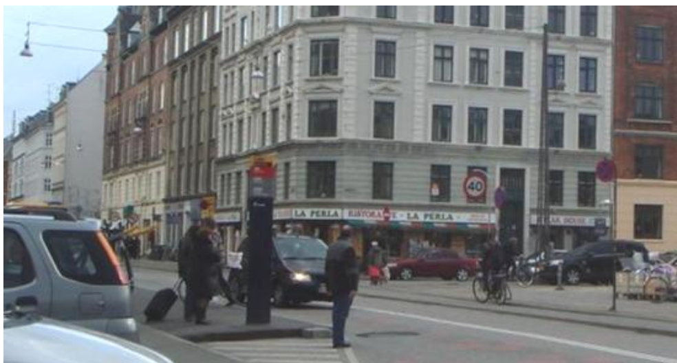
Figur 5.3: Gående, der venter på at krydse Nørrebrogade ved busperronen.

Både før og efter nedlæggelsen af busgaden blev de fremrykkede perroner brugt af gående som støttepunkter for at krydse vejen. Antallet af biler efter nedlæggelsen af busgaden gav ikke umiddelbart anledning til, at der blev observeret konflikter, men alt andet lige er barrierevirkningen naturligvis øget. Den signalregulerede krydsning af den grønne cykelrute ligger meget tæt på, og denne benyttes også af mange fodgængere som en sikker krydsningsmulighed.