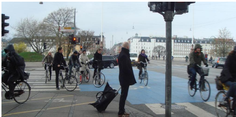
Figur 5.9: Venstresvingende cyklister, som delvist holder på fodgængerfelt for ikke at spærre stiforbindelsen

En anden observation er, at venstresvingende cyklister mod Øster Søgade/Gothersgade sørger for ikke at blokere cykelstien, men holder i stedet på fodgængerfeltet, se Figur 5.9.