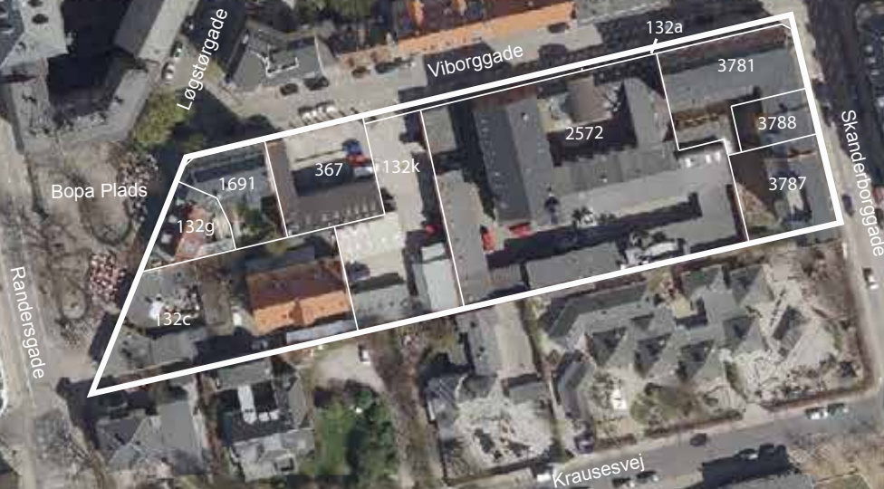
Lodfoto af området 2013.

Principper for udarbejdelse af forslag til lokalplan Viborggade med tilhørende forslag til kommuneplantillæg