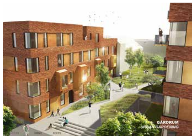
Forslag til boligbebyggelse set mod det bagvedliggende gårdhus i 3 og 4 etager. (Illustration Arkitema)