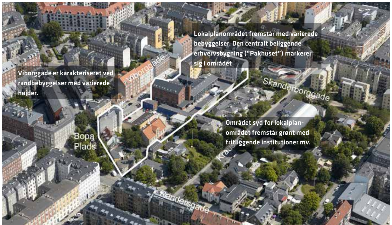
Luftfoto af området (JW Luftfoto juli 2013).