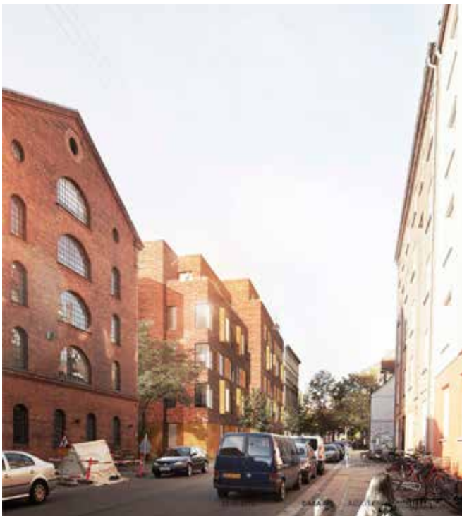
Forslag til boligbebyggelse med det forskudte forhus set fra Viborggade mod vest. Forhuset udføres i 5 og 6 etager. Gesimshøjder er tilpasset nabobygninger. (Illustration Arkitema)

Viborggade er karakteriseret ved randbebyggelser i varierede højder og med kig til Nordhavn. Den centralt beliggende erhvervsbygning (pakhuset) markerer sig i lokalplanområdet med en markant industriel arkitektur. Bebyggelserne har bevaringsværdier fra 4 (middel) til 9 (lav). De mindre én- og to-etagers bebyggelser centralt i området, som skal nedrives i forbindelse med boligprojektet, er fastlagt med en bevaringsværdi på 7 (lav) eller ingen bevaringsværdi.