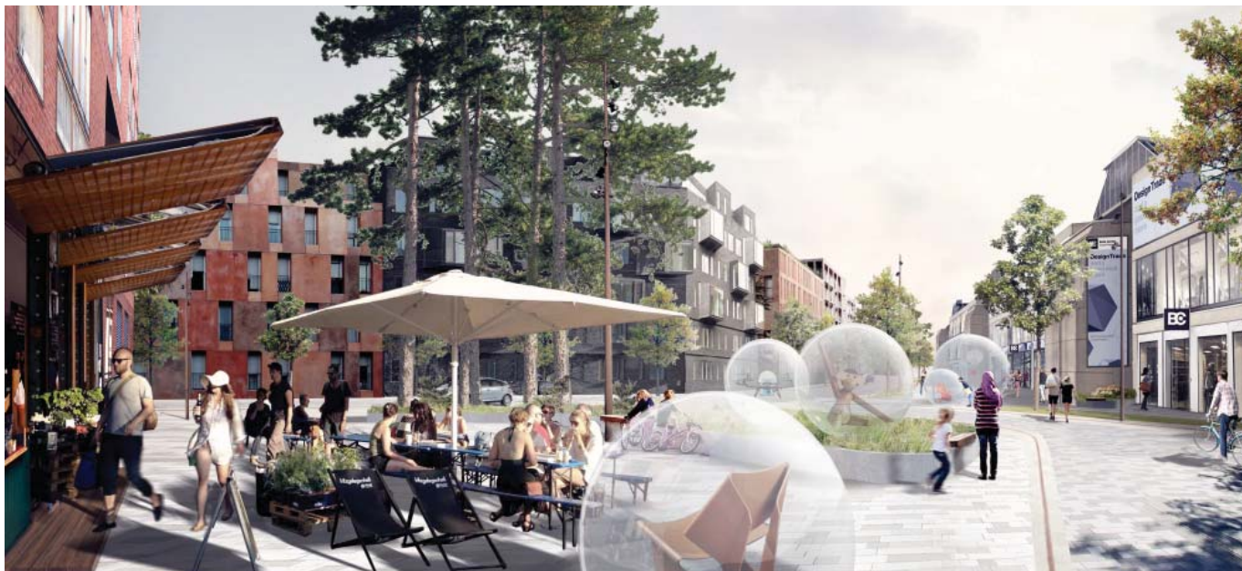
Visualisering af et byrum ved den østlige side af Bella Centeret. Byrummet fungerer også som udstillingsrum. Ill. af COBE.

Valg af farver, bebyggelsesform og beplantning skal optimere boligernes lysforhold og bidrage til et mikroklima egnet til ophold i byens rum.