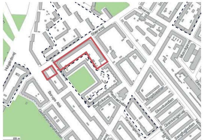
Kortudsnit, hvor Fynshuse er markeret med rød farve. Øvrige almene bebyggelser i området er markeret med stiplede linje.

Institutionen har tidligere været lejet ud til Københavns Kommune, men står nu tom. Derfor indret-