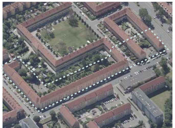
Luftfoto af Fynshuse.