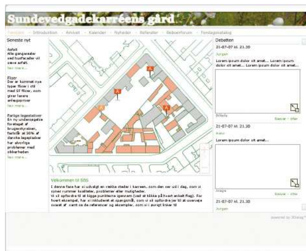
Eksempel på hjemmeside

Der er etableret et forsøg med et såkaldt 'gårdrumsspil', som skal højne borgerinddragelsen i forbindelse med udformningen af det konkrete forslag til gårdens indretning. Dette vil have til huse på en hjemmeside oprettet specifikt for denne karré. Her kan borgerne få informationer og debattere vedrørende anlæggelsen af det nye gårdanlæg. Via et brugervenligt, interaktivt 3d-værktøj har borgerne endvidere mulighed for at komme med forslag til det kommende gårdanlæg samt opleve, hvordan det vil komme til at se ud i 3 dimensioner. På alle tidspunkter i processen kan beboerne debattere egne og andres forslag og synspunkter - med mulighed for bidrag fra eksempelvis landskabsarkitekt og øvrige eksterne parter.