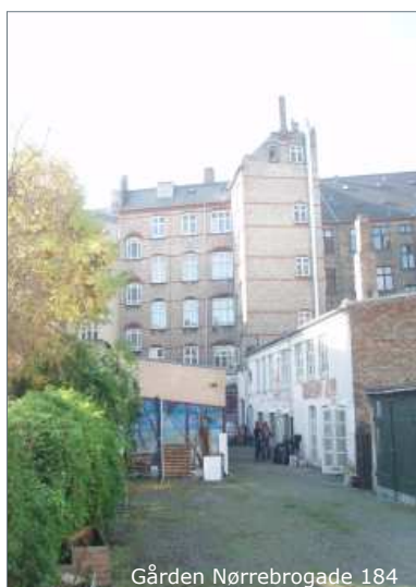
Gården Nørrebrogade 184

Forslaget omfatter rydning af udtjente belægninger og asfalt, skure og hegn. Forslaget omfatter endvidere nedrivning af baghuset til Nørrebro-