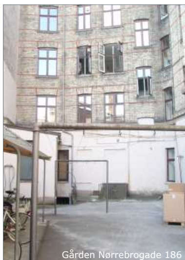
Gården Nørrebrogade 186