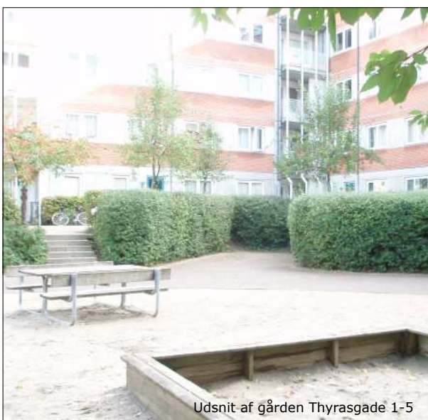
Udsnit af gården Thyrasgade 1-5

Når der foreligger en byfornyelsesbeslutning, bliver der nedsat en gårdgruppe med repræsentanter fra samtlige karréens ejendomme. På gårdgruppemøderne vil både de overordnede linjer for et kommende gårdanlæg samt den mere konkrete indretning blive debatteret. Der vil også blive arrangeret en inspirationstur til færdig-etablerede gårdanlæg. Igennem gårdgruppen får beboerne mulighed for at være med til at diskutere og komme med forslag til indretningen af det fælles gårdanlæg.