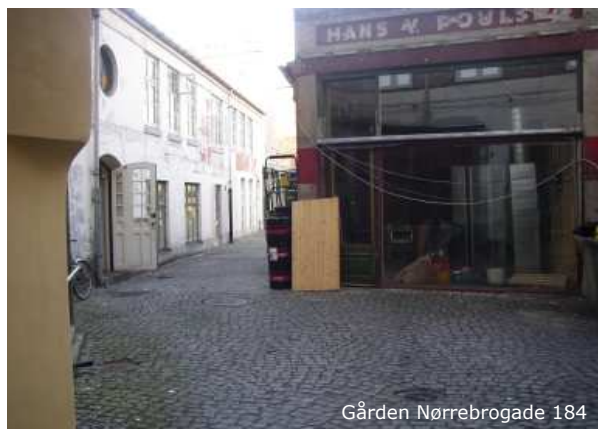
Gården Nørrebrogade 184

Karréen har mange hegn og garager, som opdelser gården.