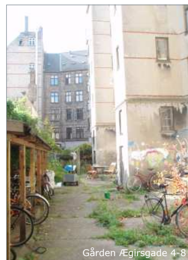
Gården Ægirsgade 4-8