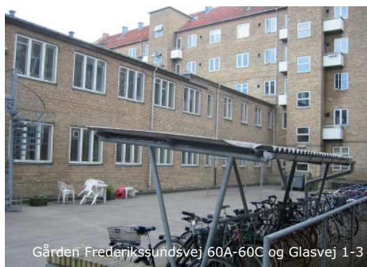
Gården Frederikssundsvej 60A-60C og Glasvej 1-3

Erhvervsejendommen, baghuset Frederikssundsvej 60D i gården er opført i 1905 og er på