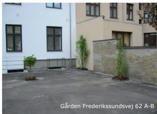
Gården Frederikssundsvej 62 A-B