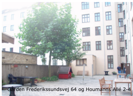
Gården Frederikssundsvej 64 og Houmanns Allé 2-4