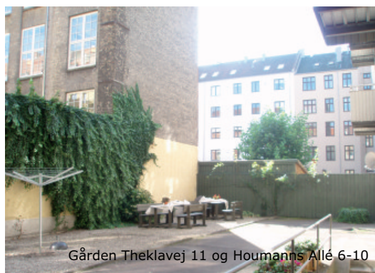
Gården Theklavej 11 og Houmanns Allé 6-10