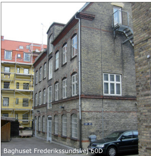
Baghuset Frederikssundsvej 60D

Når der foreligger en byfornyelsesbeslutning, bliver der nedsat en gårdgruppe med repræsentanter fra samtlige karréens ejendomme. På gårdgruppemøderne vil både de overordnede linier for et kommende gårdanlæg samt den mere konkrete indretning blive debatteret. Der vil også blive arrangeret en inspirationstur til færdig-etablerede gårdanlæg. Igennem gårdgruppen får beboerne mulighed for at være med til at diskutere og komme med forslag til indretningen af det fælles gårdanlæg.