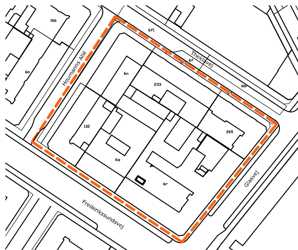
kort over Glasvej-karréen

Med dette forslag foreslås der etableret ét sam-