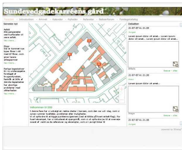
Eksempel på hjemmeside

Resultatet af denne proces vil indgå i den endelige beslutning om den konkrete indretning af