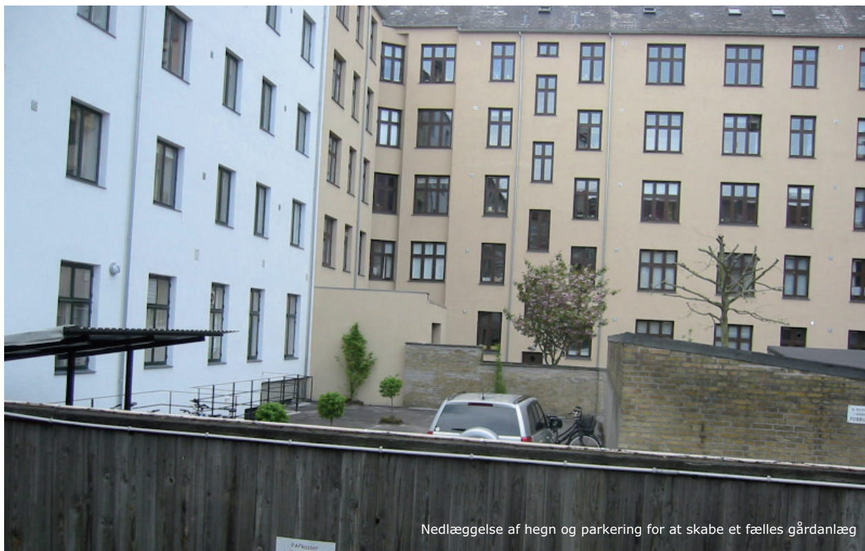
Nedlæggelse af hegn og parkering for at skabe et fælles gårdanlæg

Udarbejdelsen af projektforslaget vil ske med henblik på sammenhæng i funktioner, materialer og arkitektur for den samlede karré, således at der efter byfornyelsen vil være ét fælles sammenhængende gårdanlæg for beboerne i karréen med fælles drift.