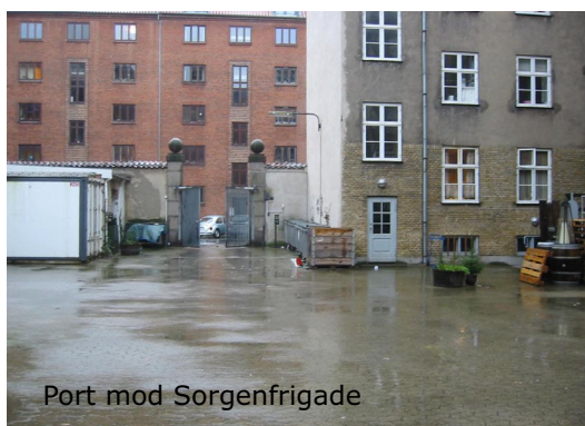
Port mod Sorgenfrigade

Stefansgade 9 har i dag adgang for kørende trafik ad en større port i Sorgenfrigade, og over ejendommen Søllerødgade 40-42/Sorgenfrigade 10. Der er dagligt tung trafik over denne del af gården, ligesom erhverv og private parkerer i de