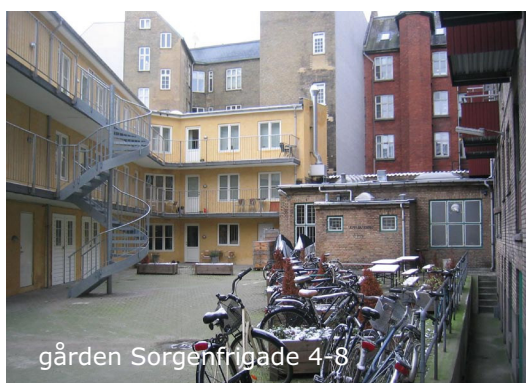
gården Sorgenfrigade 4-8