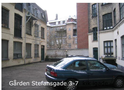
Gården Stefansgade 3-7 kikk lade