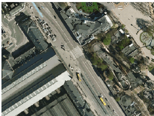
KK-kort - ortofoto 2009

Konsekvens: Letbanen vil få dårlig fremkommelighed, ligesom tilfældet vil være for busser og biler. Trafikken vil kunne bryde sammen. Gaden vil i øvrigt have samme funktionalitet som i dag. Trafiksikkerheden vurderes ikke at blive påvirket af ændringerne.