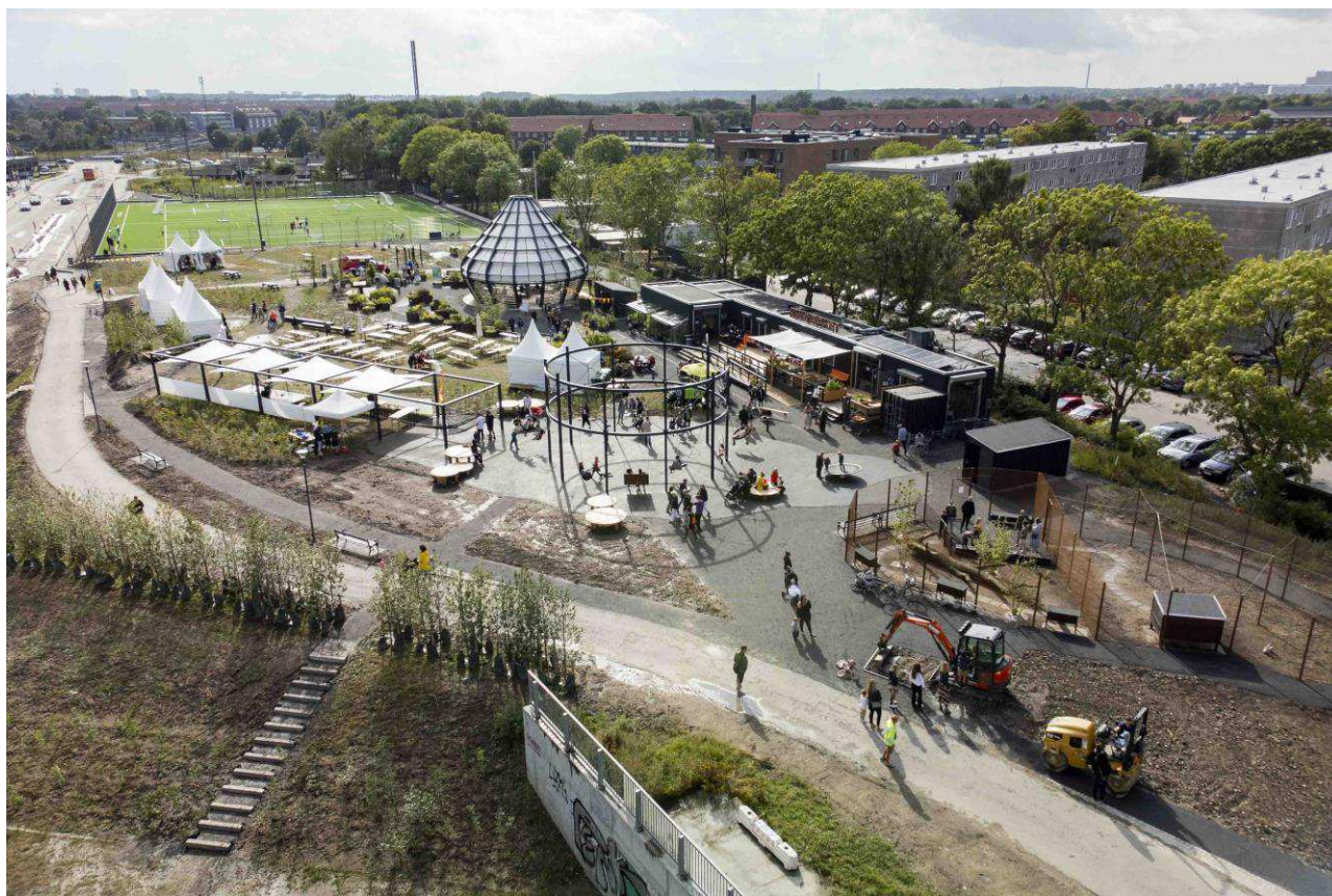
Kulbaneparken i Valby, udviklet i samarbejde med beboere, frivillige og aktører i nærområdet gennem Områdefornyelsen Kulbanekvarteret fra 2016-2021.

De nye forbindelser har gjort at flere færdes gennem Kulbaneparken til dagligt, mens nye samlingssteder har gjort bylivet mere levende.