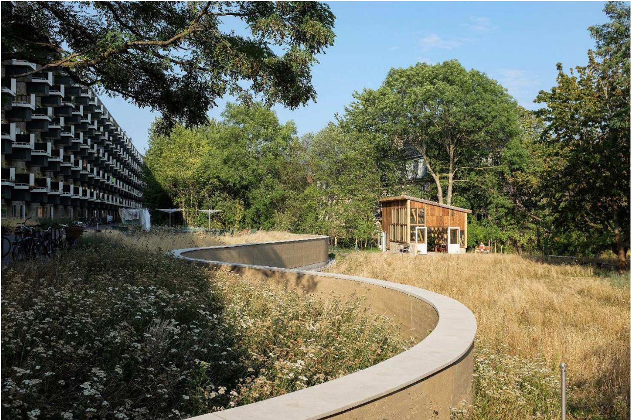
Fremtidens Gårdhave ved Tomsgårdsvej