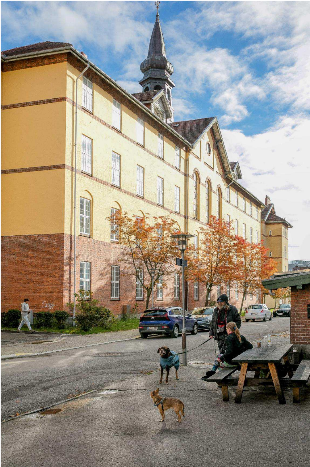
Sønderbro Områdefornyelsen