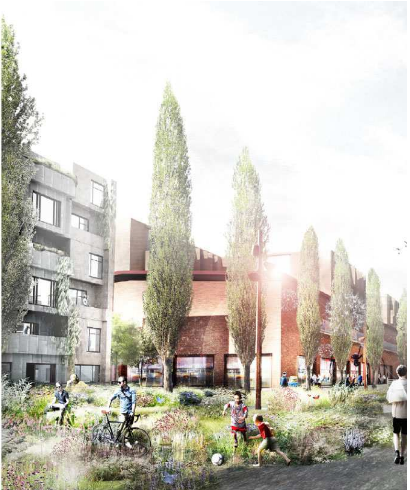
Visualisering af det grønne forløb ved Legehaven

Herunder den nuværende plan som By & Havn har lagt op på deres hjemmeside ( https://byoghavn.dk/nordhavn/sundmolen/ ):