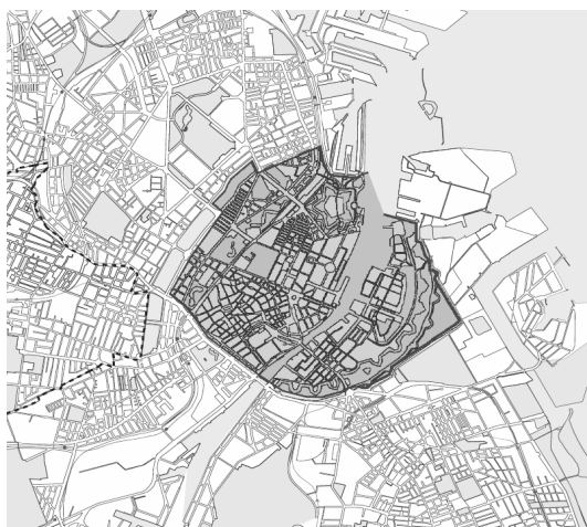
Figur 1. Forbudszones afgrænsning (Københavns Kommune 2008).

Forbudszone må ikke forveksles med den såkaldte miljøzone, der blev indført den 1. september 2008. Denne zone omfatter store dele af København og Frederiksberg. Miljøzonens afgrænsning ses på figur 2. Heri tillades kun kørsel med lastbiler over 3,5 ton, hvis de opfylder Euro 3 eller Euro 4 standard. Ældre lastbiler må have godkendt partikelfilter (Københavns og Frederiksberg Kommune 2008).