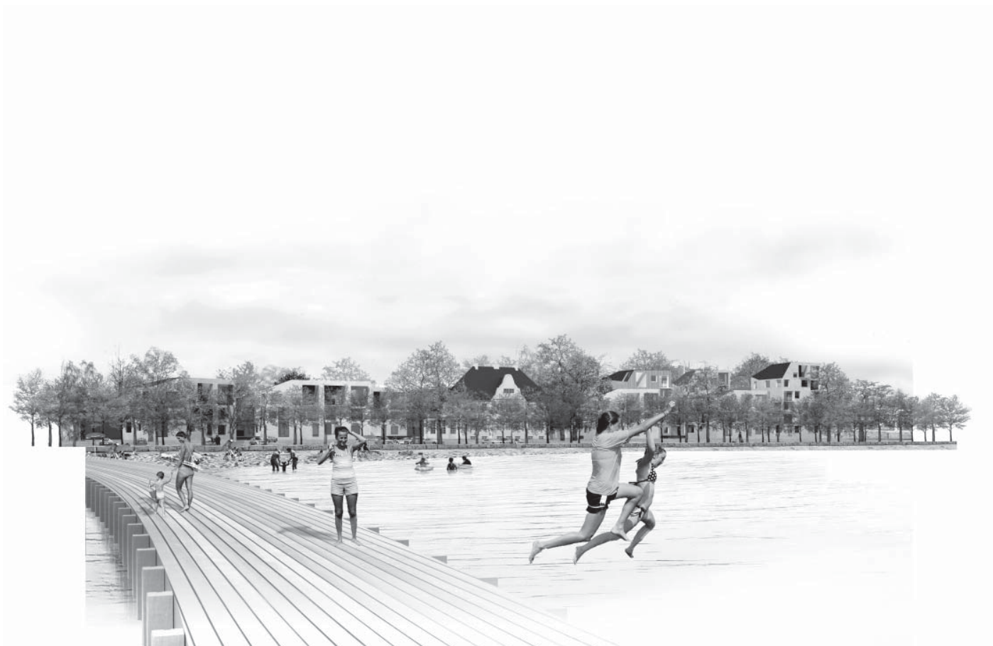
input til udbygningsaftale, entasis 2010 09 03