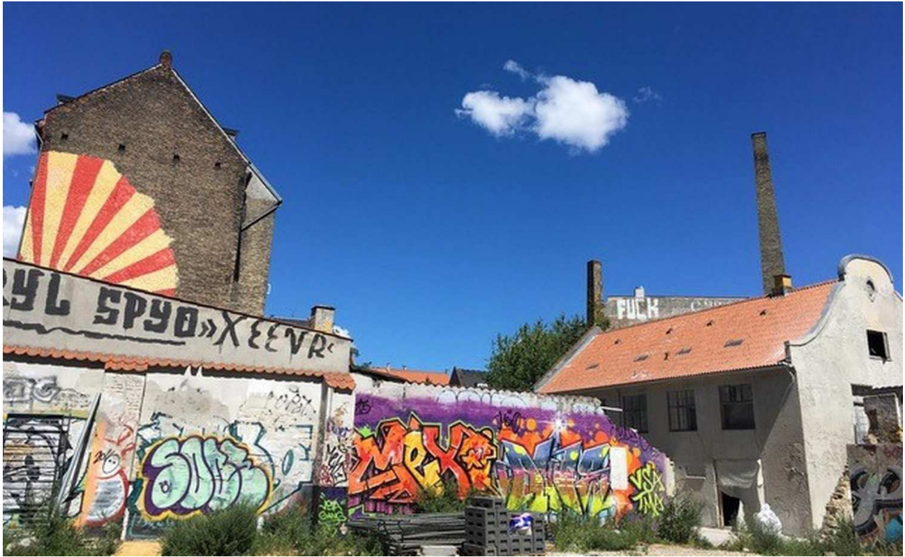
Slagtergårdene på Vesterbro i København i 2018, inden de blev revet ned.

Jokum Rohde, forfatter og dramatiker, skriver i en kommentar til indlægget: