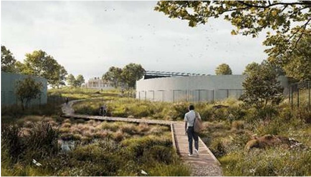
Fra Aarhus Rewater projektet (Henning Larsen for Aarhus Vand): Integrering af et spildevandsanlæg i den tætte by på Aarhus Havn. Anlægget bliver en rekreativ park frem for et lukket industriområde. Rending: Henning Larsen