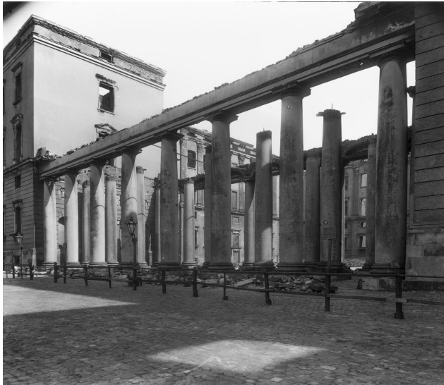
Brandruin af 2. Christiansborg.

oversættelse af Bibelen, så vi nu skal »tage ansvar« for naturen.