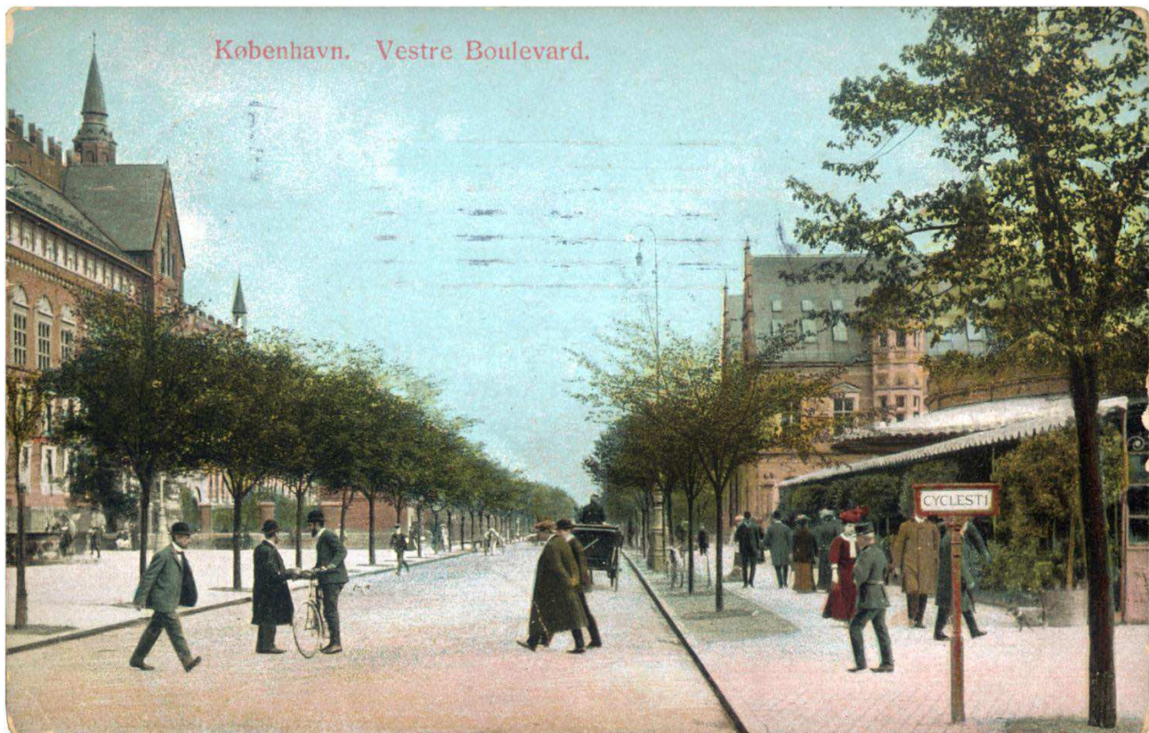
Tredje Natur skriver: »Postkort fra fremtiden? Liveability, grøn mobilitet og bynatur anno 1907. Vestre Boulevard (nu H. C. Andersens Boulevard).«

Come on, Copenhagen – lad os se en visionær plan for fremtidens cykelby!