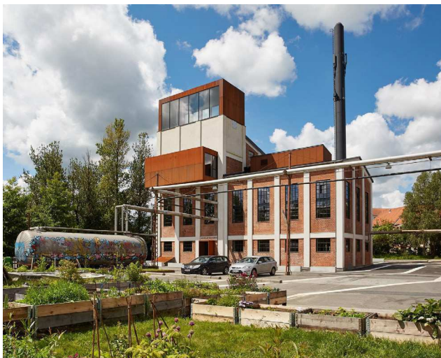
Kedelbygningen i Vejle, som Schmidt Hammer Lassen har været med til at restaurere sammen med Spinderihallerne. Foto: Schmidt Hammer Lassen

Udkastet til loven – den er endnu ikke vedtaget – foreskriver, at der kun bør gives tilladelse til nedrivning på baggrund af en »interesseafvejning«, hvor bygningens arkitektoniske kvalitet, værdi for offentligheden og dens betydning i bystrukturen tages i betragtning.