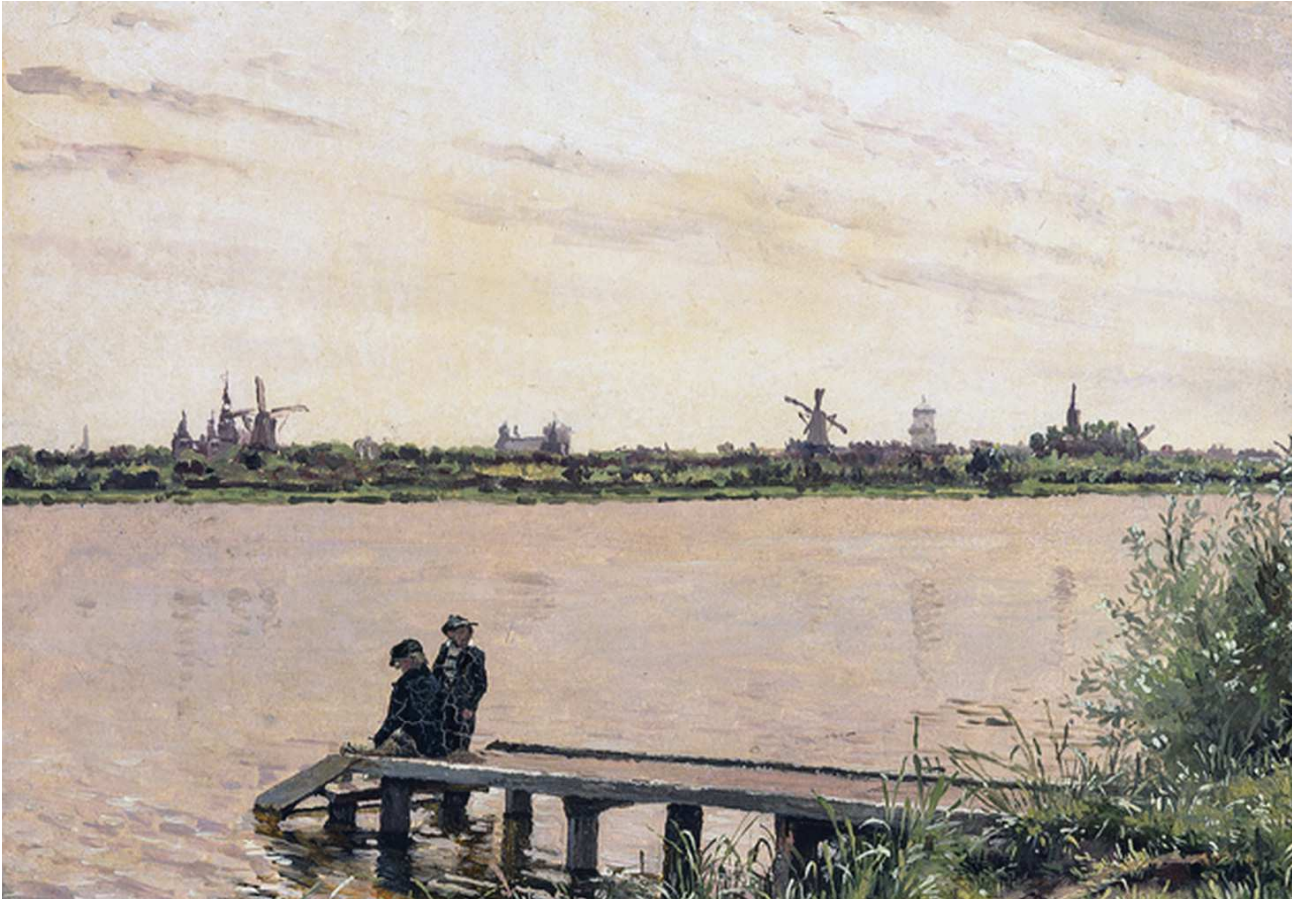
Udsigt til København set fra Sortedamssøseringen ca. 1837. Maleri: Christen Købke/Ordrupgaard

og byggerirøveri, men en vældig indånding af frihed og fællesskab. Aum!