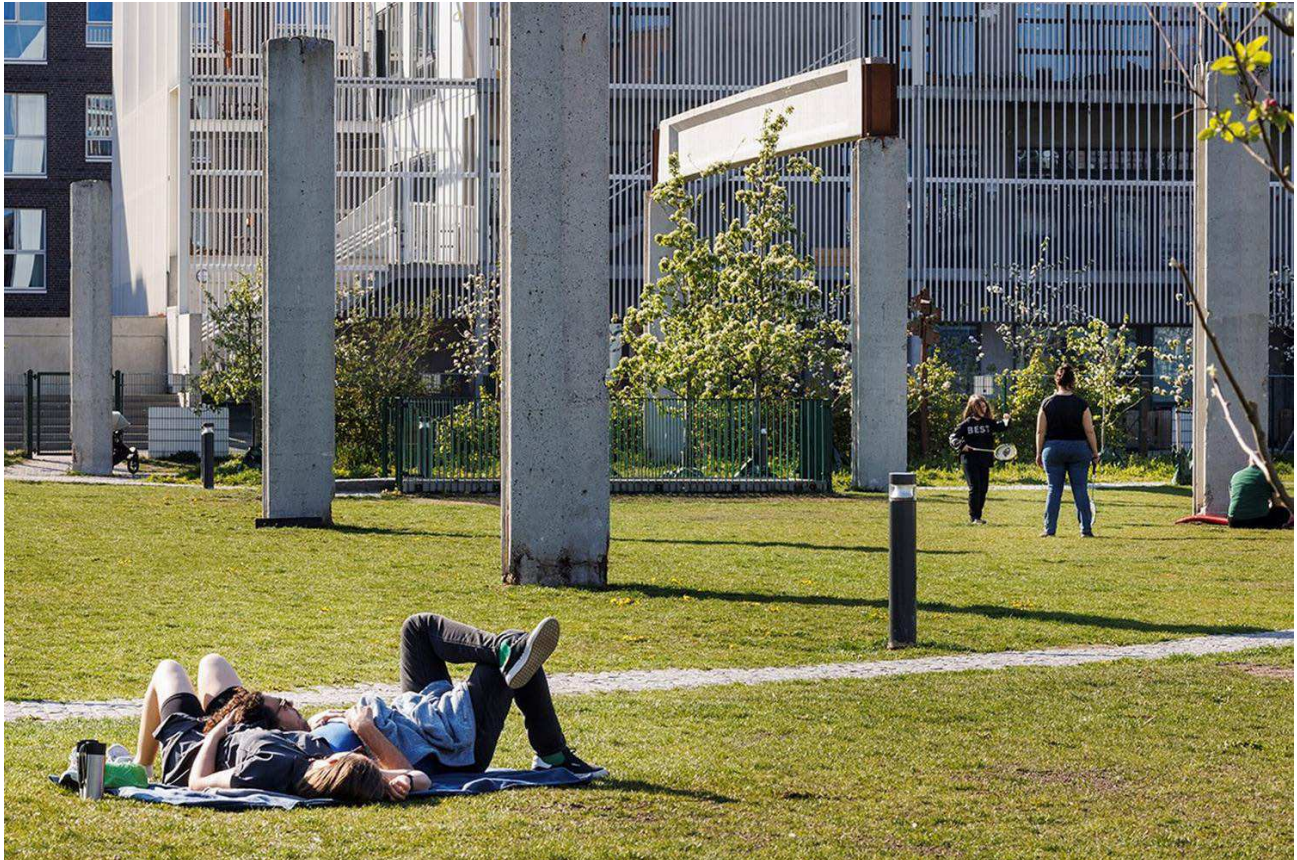
I Grønttorvsparken i København er der plads til at dase i solen eller et improviseret boldspil.

Kongens Have, Ørstedsparken – alle byens grønne, gammeldags parker er fyldt med unge mennesker, familier og hundeluffere i alle aldre.