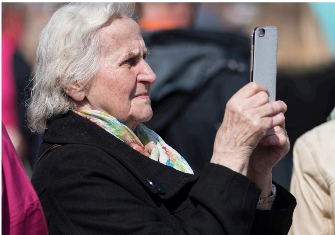
Christian Lindgren/Scanpix Denmark/Ritzau Scanpix