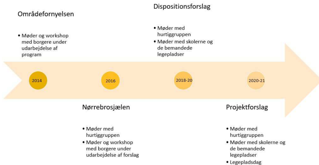
Figur 2 - Oversigt over inddragelse af borgere og interessenter i Hans Tavsens Park projektet.

eleverådets kommentarer. Desuden deltog en medarbejder fra indskolingene, som blandt andet kom med vigtige input om elevernes behov for at krydse Mellemrummet i skoletiden.