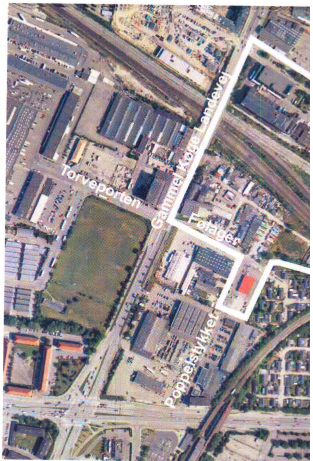
Lodfoto med indramning af lokalplanområdet og gadenavne.