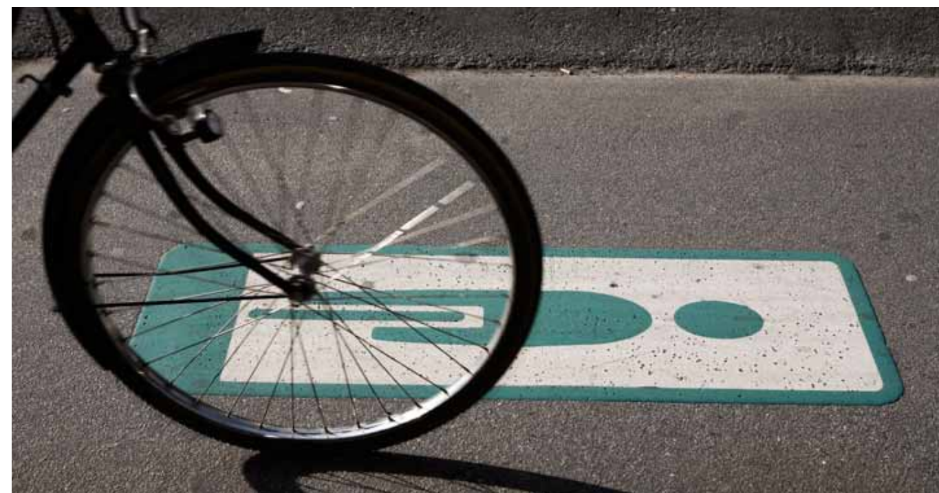
Før-grønt og grønne bølger for pendlercyklister