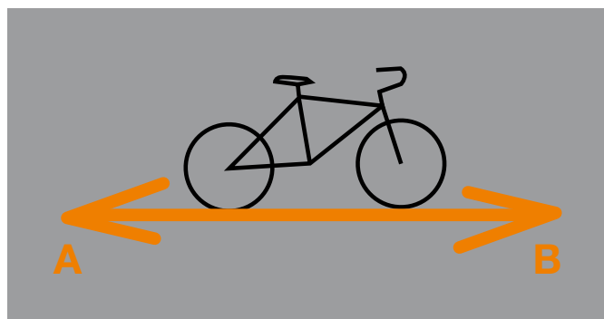
Den mest direkte vej