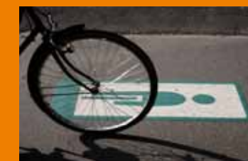
Eksemplerne bygger på det ideelle løsningsforslag.

To strækninger på ruten får grøn bølge for cyklister. Det sker ved Danasvej/Thorvaldsensvej og Finsensvej på Frederiksberg. Det betyder mere grønt lys for cyklister og dermed forkortet rejsetid. Tre-fire kryds får signaler med nedtælling for cyklisterne.