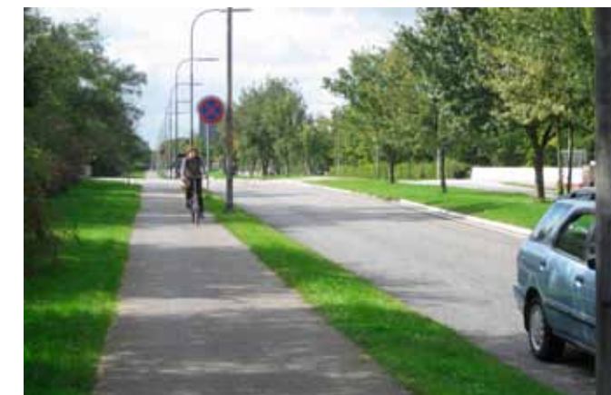
Brede stier med god adskillelse