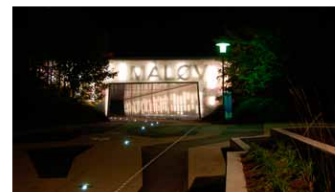
Belysning og synlighed

"If we really want to see levels of obesity declining, we have to move on from the rhetoric. We need to see a visible investment in infrastructure that makes cycling and walking the travel modes of choice"