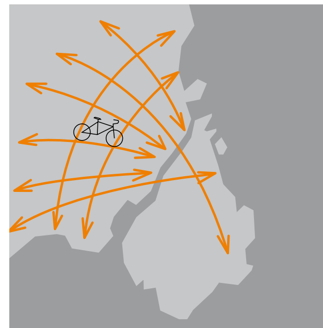
Hurtigst muligt fra A til B