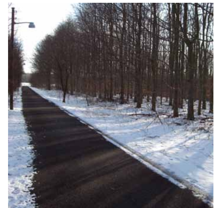
Høj grad af vedligehold