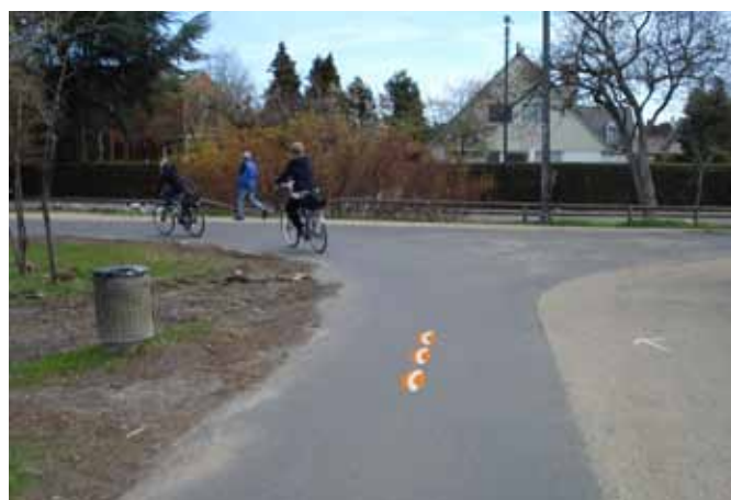
Synlig skiltning og information