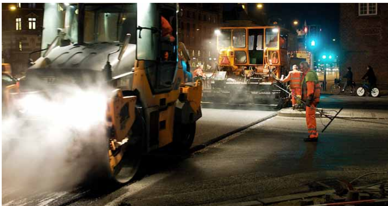
Høj prioritering af drift og vedligehold