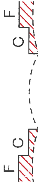
Stitype 1 Cykelsti + fortov