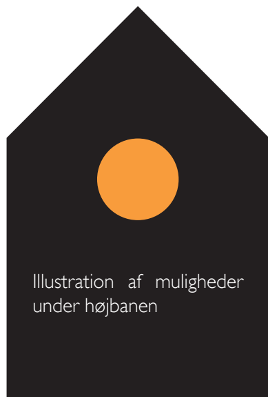
Illustration af muligheder under højbanen