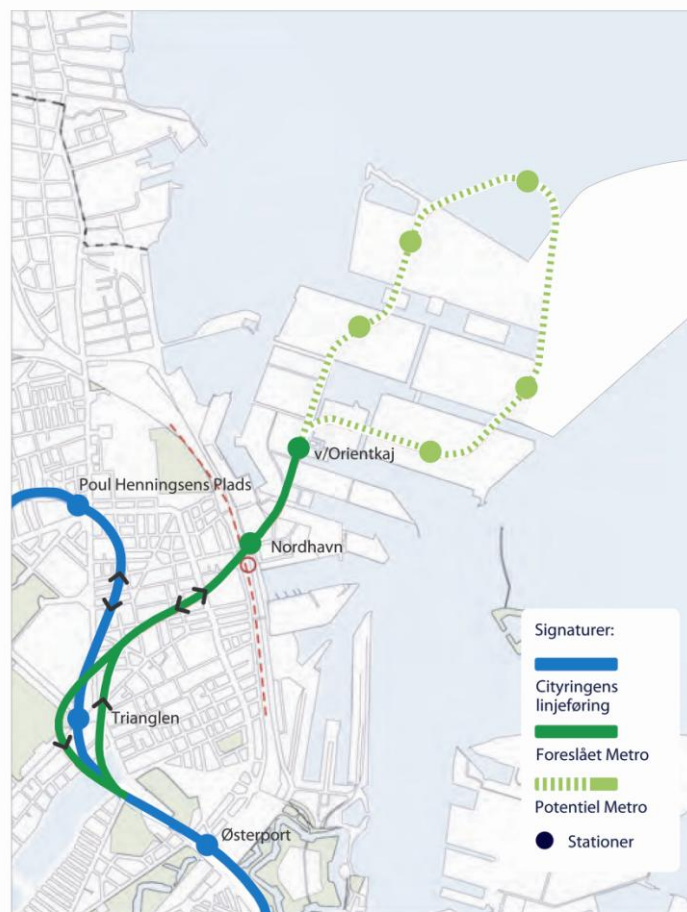
Cityringens afgræning til Nordhavn.