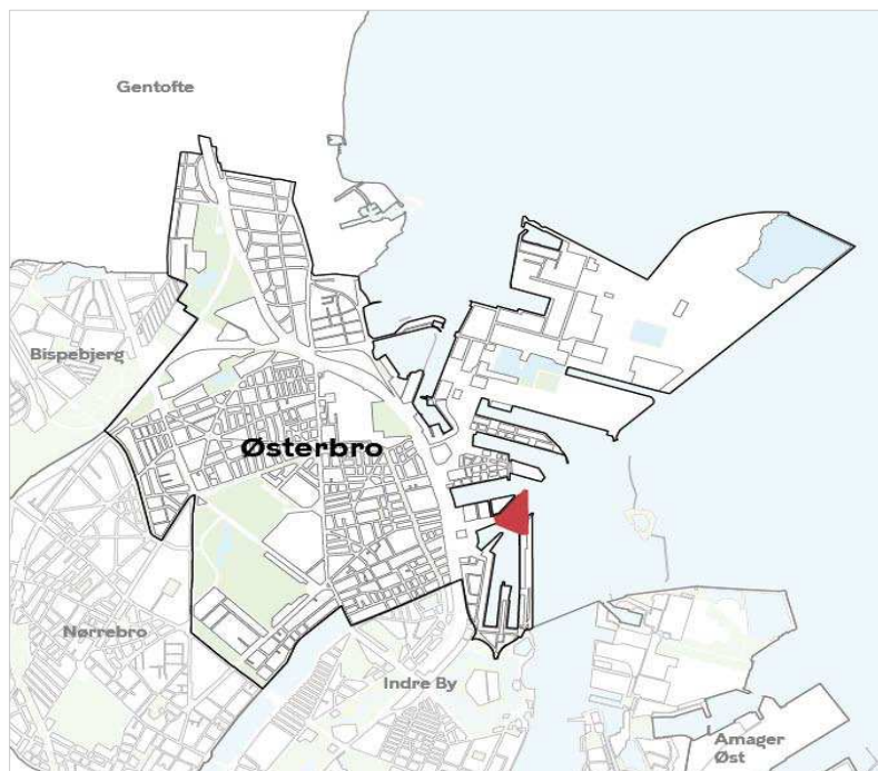
Områdets placering i bydelen.

Projektområdet strækker sig over matriklerne 1d, 1e, 1g og 5, alle beliggende i Frihavns kvarteret, København. Området har et samlet grundareal på 10.711 m 2 . I det foreløbige projektforslag vil byggeriet og parken på Marmormolen hver især optage ca. halvdelen af grundarealet.