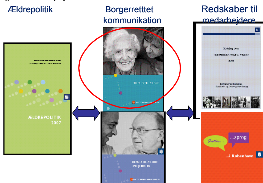
Figur 1 Koncept for kvalitetsstandarder

Kataloget revideres ligeledes til en 2009-udgave, og afventer beskrivelsen af de tilbud som skal justeres i forbindelse med implementeringen af budgetudmøntning pr. 1. januar 2009. Når kataloget er tilrettet, skal ældrerådet have det i høring, hvorefter det skal behandles politisk. Vejledning om Fælles sprog i København er udarbejdet i forbindelse med operationaliseringen af visitationskriterierne i kataloget. Vejledningen skal dels sikre, at der internt i SUF opnås en ensartet forståelse af indhold og anvendelse af de enkelte områder i visitationsværktøjet Fælles Sprog, og dels at der opnås en ensartet praksis i forhold til funktionsvurderingen (scoring 1-4). Funktionsvurderingen kommer i det nye koncept i forbindelse med styringskæden til at spille en større rolle for, hvilke ydelser borgeren som udgangspunkt har ret til efter en konkret og individuel faglig vurdering, jf. figur 2 neden for.