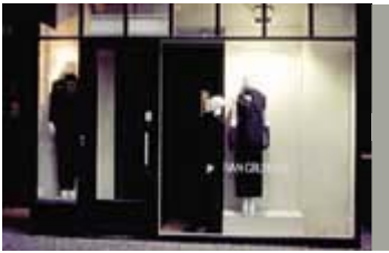
Lyset fra butiksudstillingen er ofte tilstrækkelig belysning, Niels Hemmingsens Gade 4.