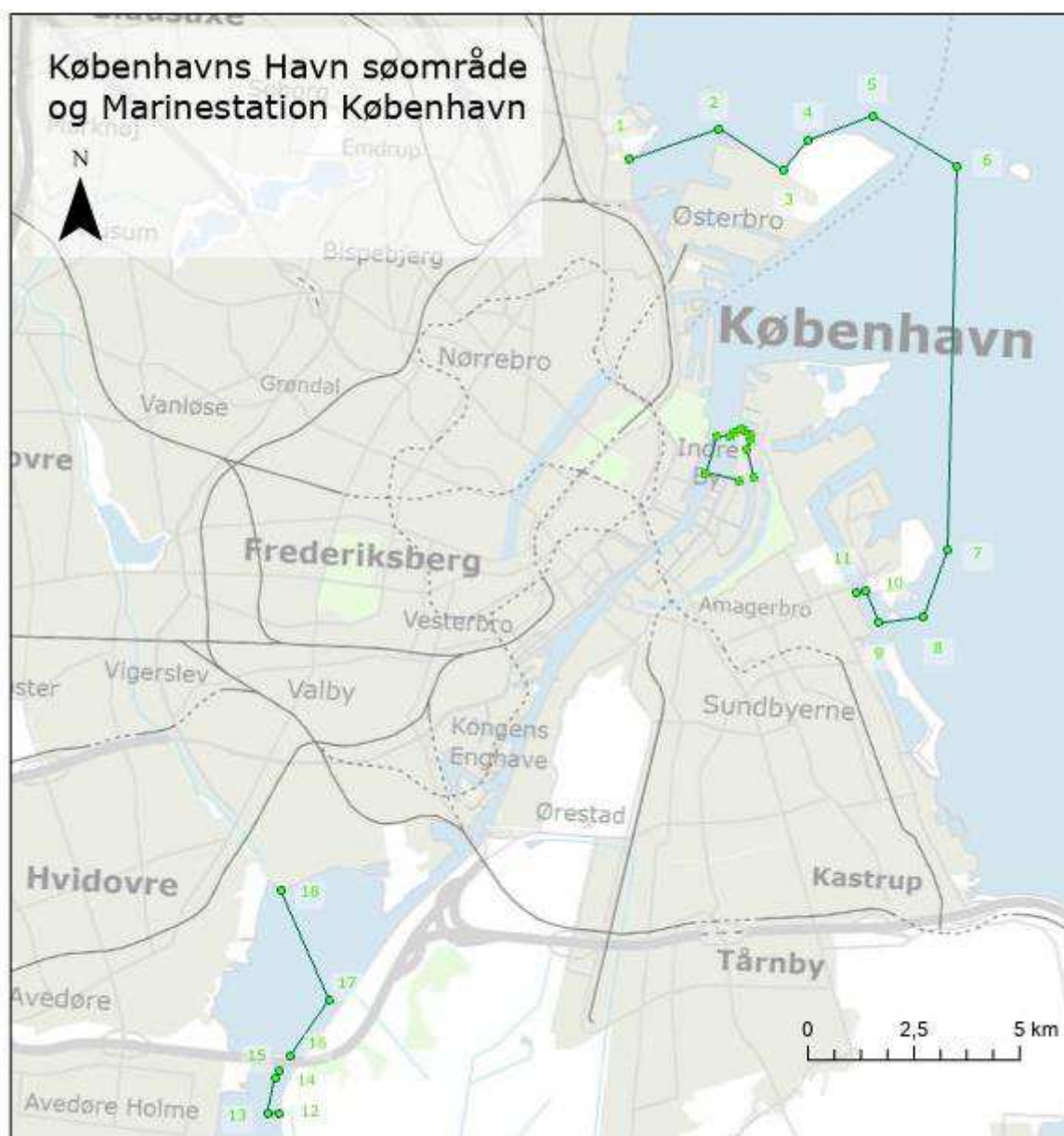
Afgrensning af Københavns Havns søområde