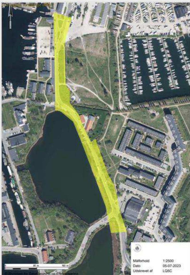
Figur 1. Projektområdet markeret med gul (fra (Københavns Kommune, 2024))

til bevaringsværdige træer og eksisterende lokalplanlagte friarealer mod øst. På den midterste strækning udvides tracéet mod vest ud i Minebådsgraven og dermed tages der hensyn til Lynettens østlige sikringsanlæg samt fredede og bevaringsværdige bygninger og anlæg, og på den nordlige strækning udvides tracéet mod øst, så der tages hensyn til bebyggelsen på Krudtløbsvej.