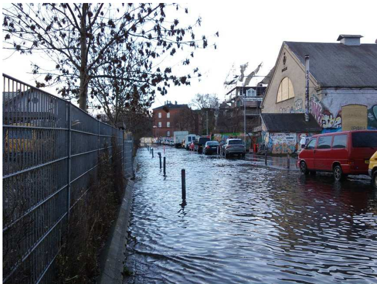
Refshalevej - dage efter stormen bodil 2013