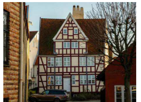
Eksisterende bygning på Wilders Plads 7. Bygningen er fredet og bevares.