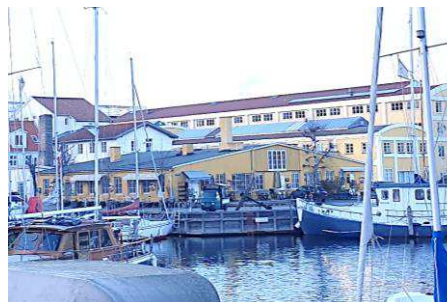
Eksisterende bygning Wilders Plads 11, set fra syd. Bygningen nedrives.