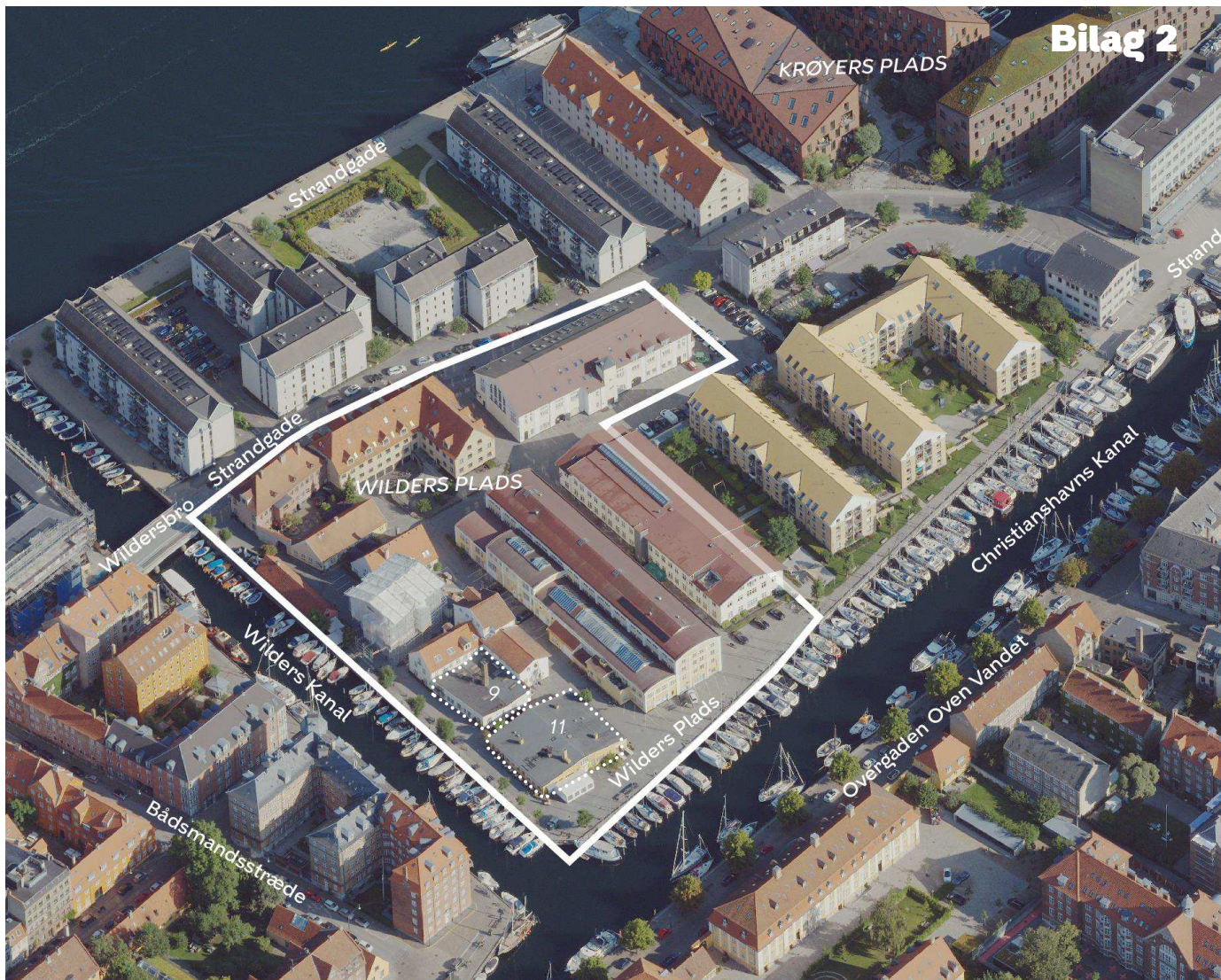
Området set mod nord. Lokalplanområdet er indtegnet med hvid linje, byggefeltene er markeret med stiple og de vigtigste gader og kanaler er navngivet.