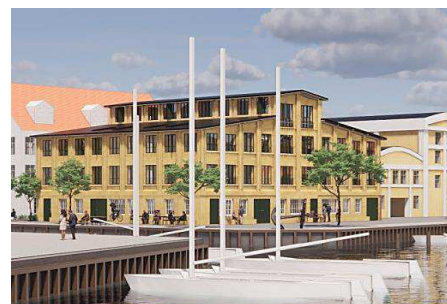
Eksempel på nybyggeri, Wilders Plads 11, set fra syd. Illustration: Lundgaard & Tranberg Arkitekter.