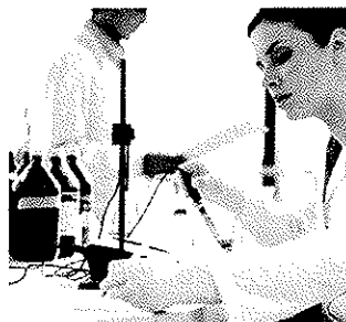
Vidensbaserede virksomheder på Nørre Campus