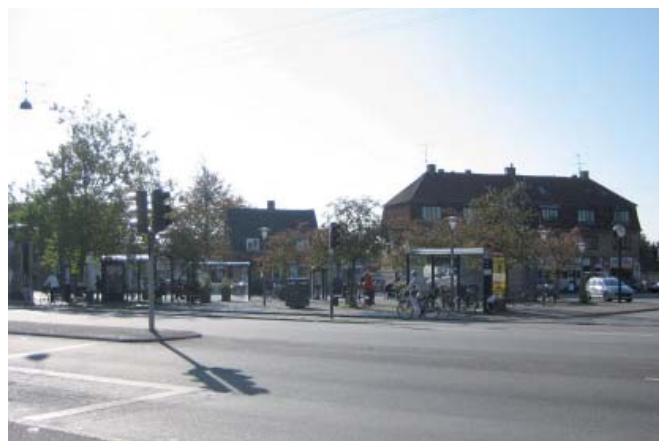
På Frederikssundsvej mangler overgange, der gør det nemmere for bløde trafikanter at krydse den trafikerede gade.