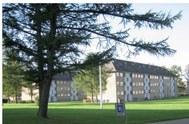
Plejecenteret Bystævneparken (øverst) og det almene boligområde Voldparken, der begge ligger nord for Frederikssundsvej.