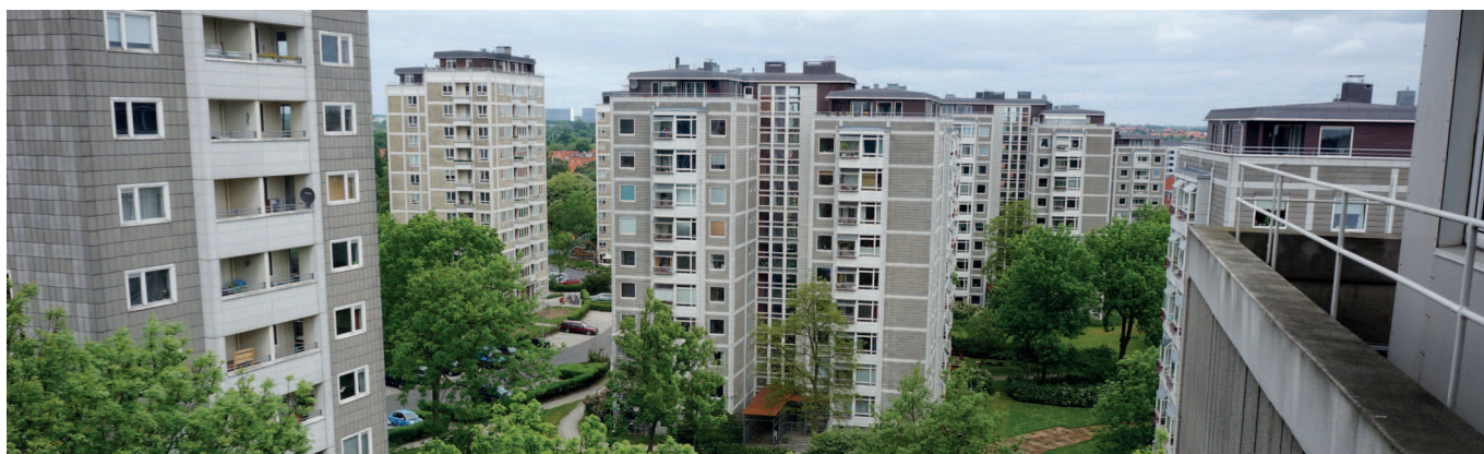
Bellahøjbebyggelsens 28 højhuse står i et stort, grønt parklignende landskab tegnet af landskabsarkitekten C. Th. Sørensen. En samlet plan for renovering og opgradering af landskabet for alle fire boligafdelinger i Bellahøj er under udvikling.