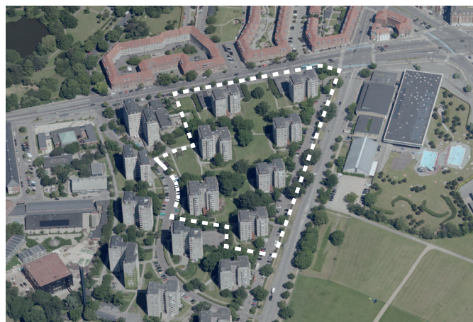
Luftfoto af Bellahøj AAB afd. 40