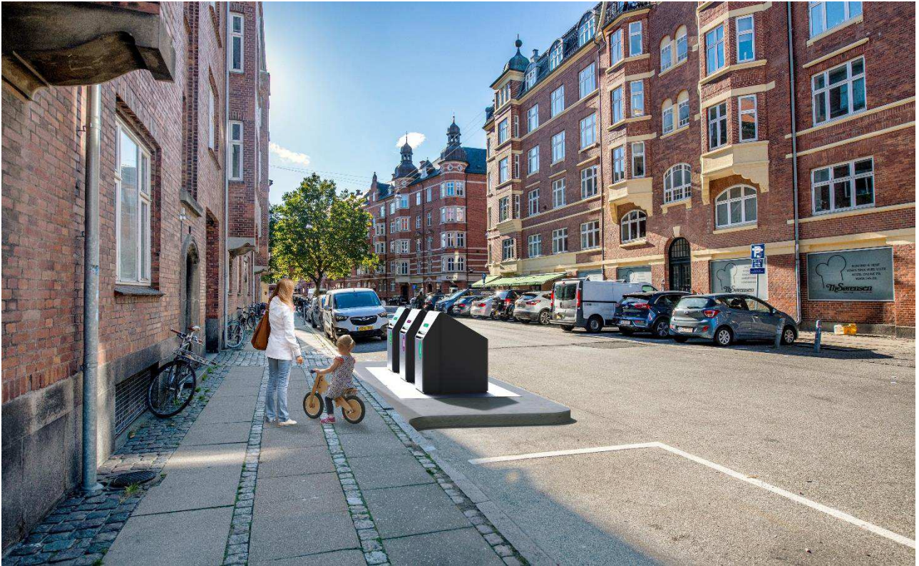
Eksempel på sorteringspunkt med tre nedgravede beholdere. Placering samt udformning af affaldsløsninger og anlæg er ikke nøjagtig gengivelse af hvordan et sorteringspunkt kommer til at fremstå.