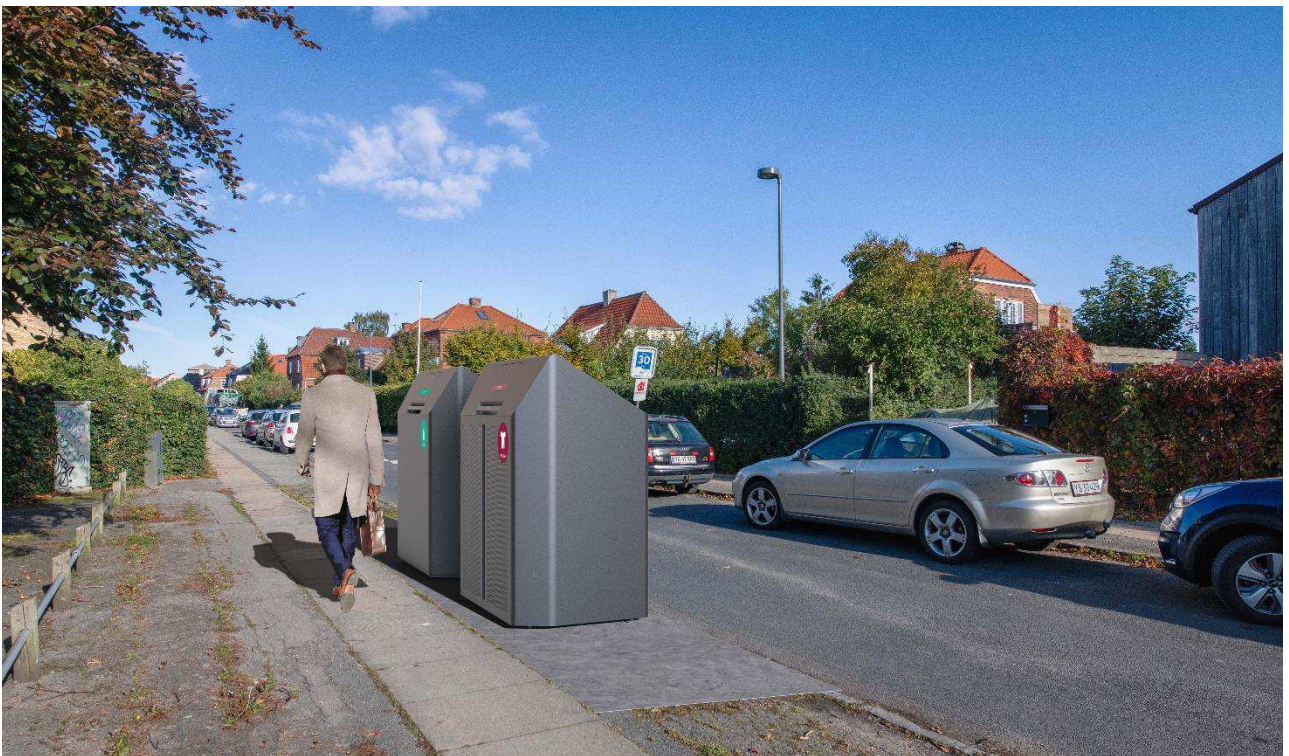
Eksempel på sorteringspunkt med en kube (bagerst) og et skjul (forrest). Placering samt udformning af affaldsløsninger og anlæg er ikke nøjagtig gengivelse af hvordan et sorteringspunkt kommer til at fremstå.