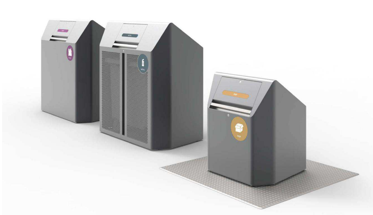
Illustrationen viser de tre typer beholdere, som et sorteringspunkt kan bestå af: (fra venstre) kuber, skjul og nedgravede beholdere.

I forbindelse med forberedelse af anlægsarbejdet skal sorteringspunkterne detailprojekteres. Detailprojekteringen kan afdække eksempelvis anlægs- eller driftstekniske forhold som medfører, at forvaltningen vil være nødt til at justere et sorteringspunkt, sløjfe et sorteringspunkt eller ændre på hvilke parkeringspladser, der skal nedlægges. Ydermere vil der skulle dispenseres for bestemmelser i lokalplaner i forbindelse med nogle af sorteringspunkterne.