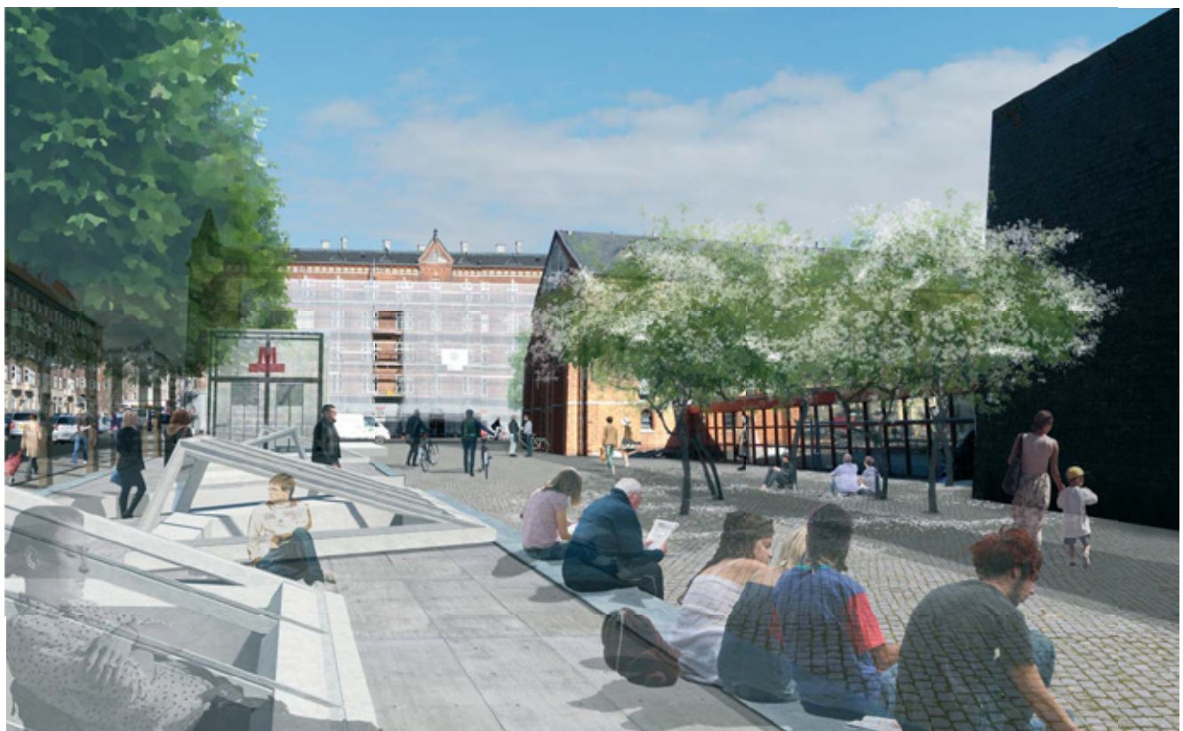
Visualisering af fremtidig metrostationsplads - Nuuk's Plads (illustration, Metroselskabet)