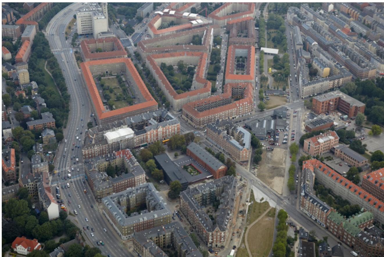
Nuuk's Plads, 2010 (JW ©)