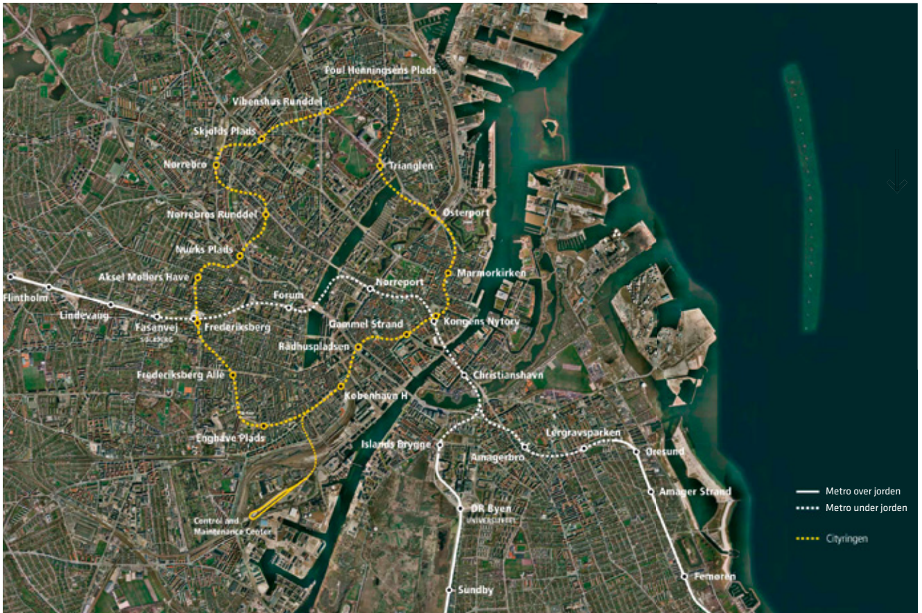
Oversigt over Cityringens linjeføring