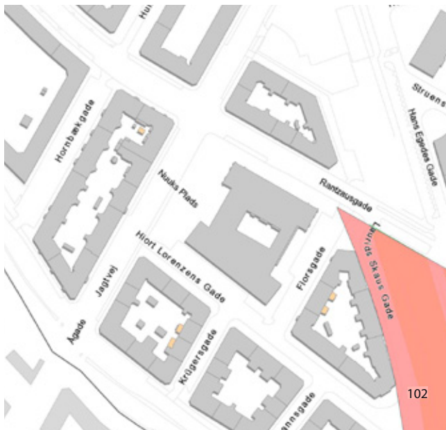
Lokalplaner i området

udnyttelse af gaderummene indgår et ønske om at skabe rum til bevægelse, oplevelser og fællesskab på en sjov og tryk vis i grønne og urbane omgivelser. Lokalplanen understøtter en forbedring af byrummet ved Landsarkivet, som får en mere grøn og urban karakter med plads til ophold og byliv. Lokalplanen rummer mulighed for yderligere funktioner såfremt der opstår mulighed for dette.