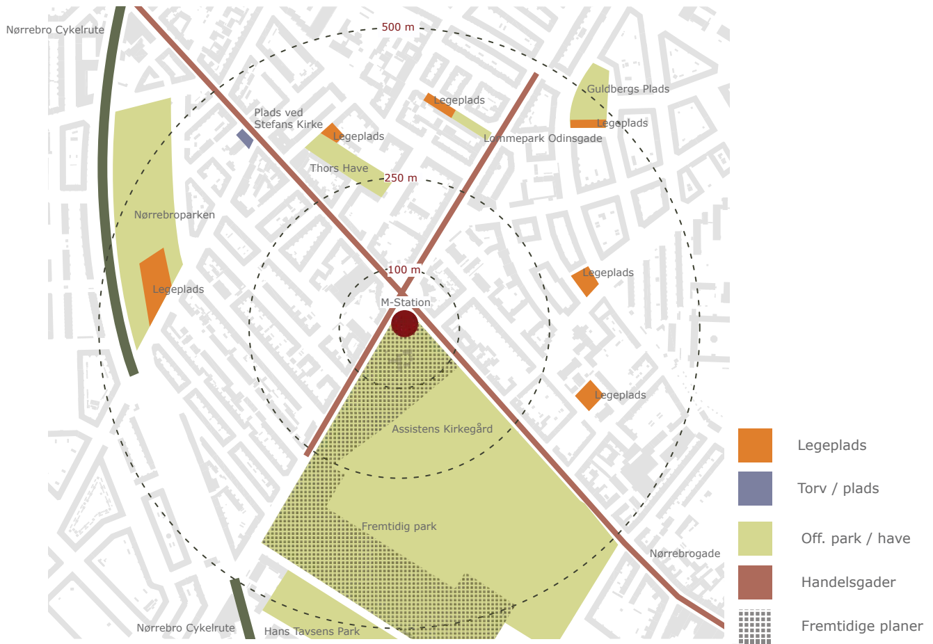
Stationsnærhedsområde ved Nørrebros Runddel metrostationsplads (illustration, Metroselskabet)