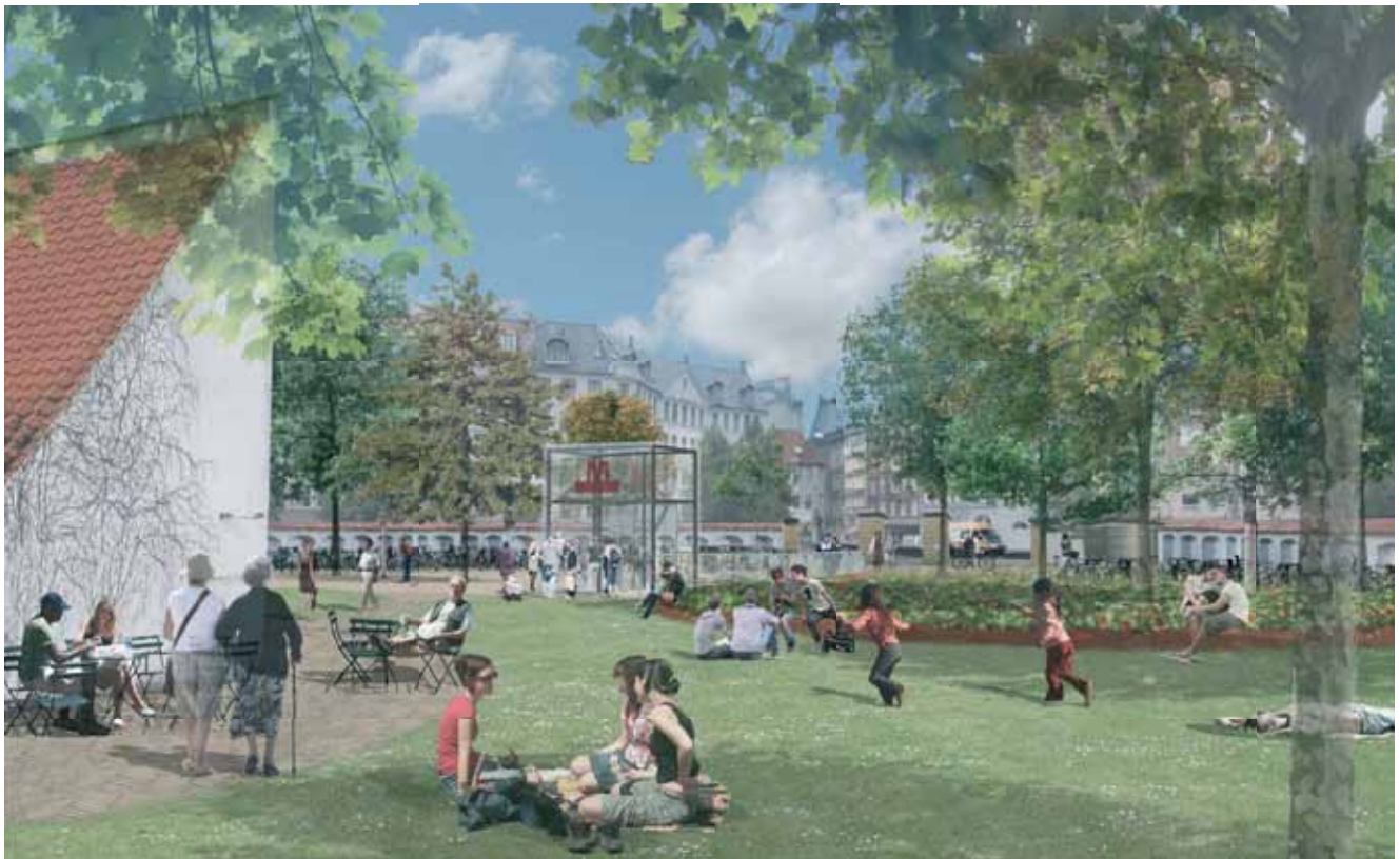
Visualisering af fremtidig metrostationsplads - Nørrebros Runddel (illustration, Metroselskabet)