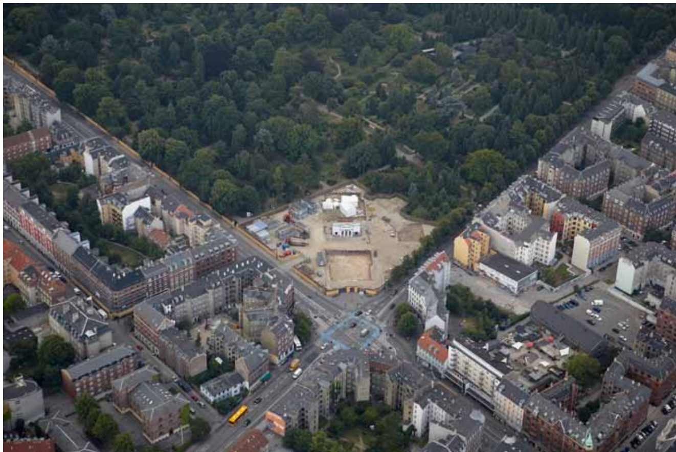
Nørrebros Runddel, 2010

byrum får tilført kvaliteter ved omdannelsen. Der vil i udformningen af stationspladser blive lagt vægt på såvel en fortsat lokal anvendelse som et effektivt flow af passagerer og tilfredsstillende forhold for cykelparkering.”