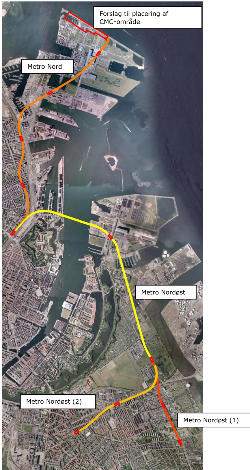
Figur 1 – Metro Nord og Metro Nordøst (2 varianter)