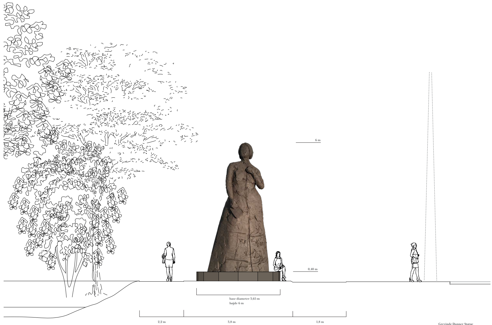
Grevinde Danner Statue Skala 1:50