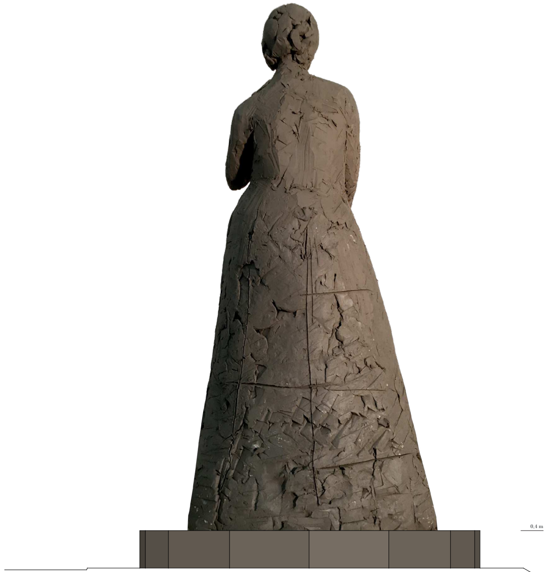
Grevinde Danner Statue Skala 1:20