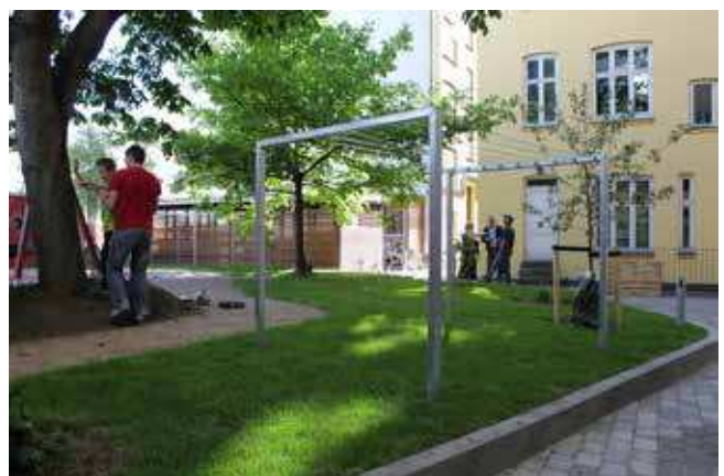
Inspiration til den fremtidige gårdhave