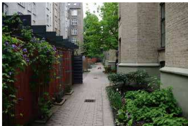
Inspiration til den fremtidige gårdhave