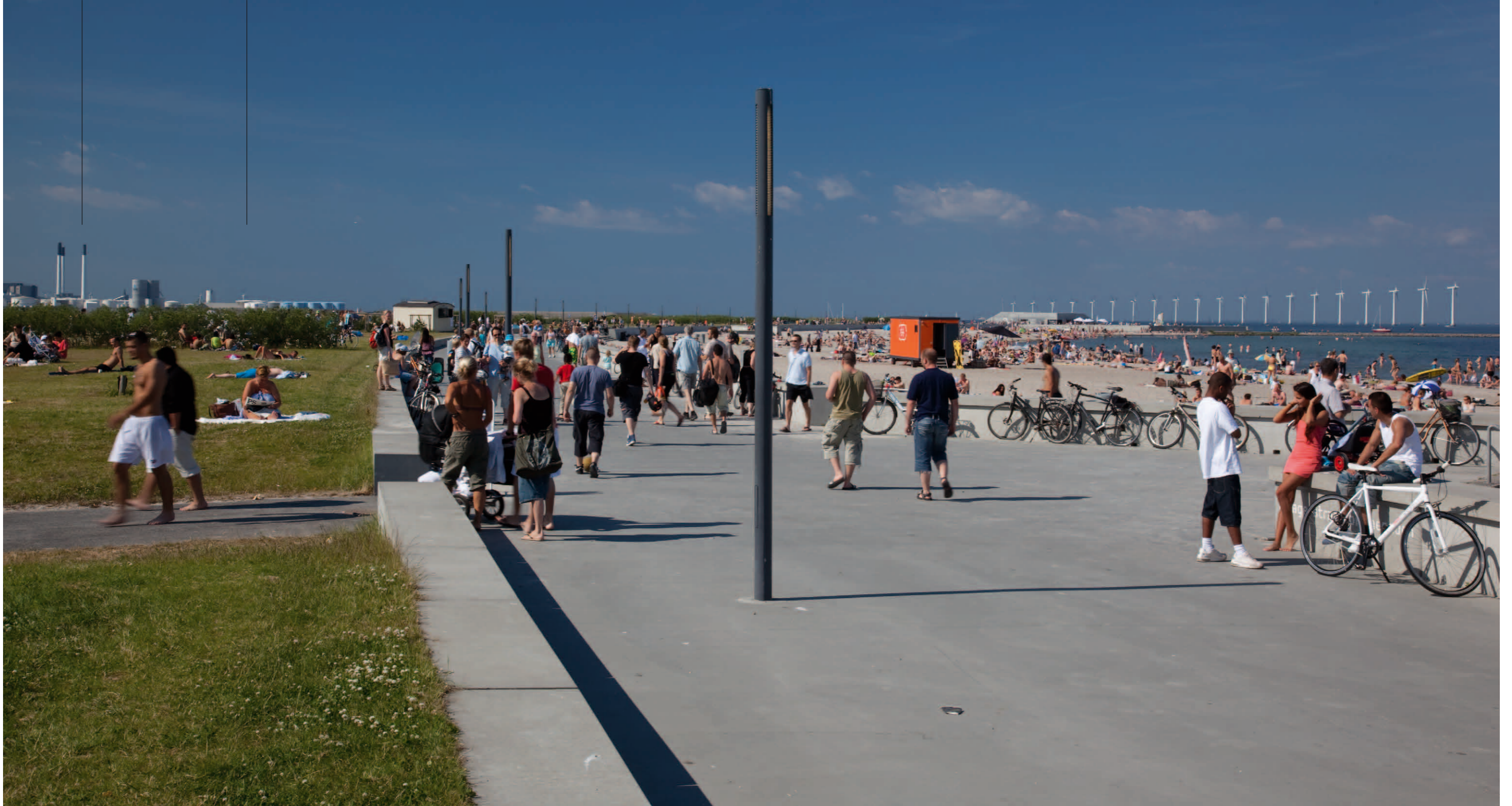
Fotopunkt 2. Den sydlige del af Amager Strandpark set mod nord med Middelgrundens vindmøller til højre og Prøvestenens oliebeholdere samt Amagerværket til venstre. Bag oliebeholderne ses de eksisterende vindmøller på Lynetten mindst 5,1 km borte.