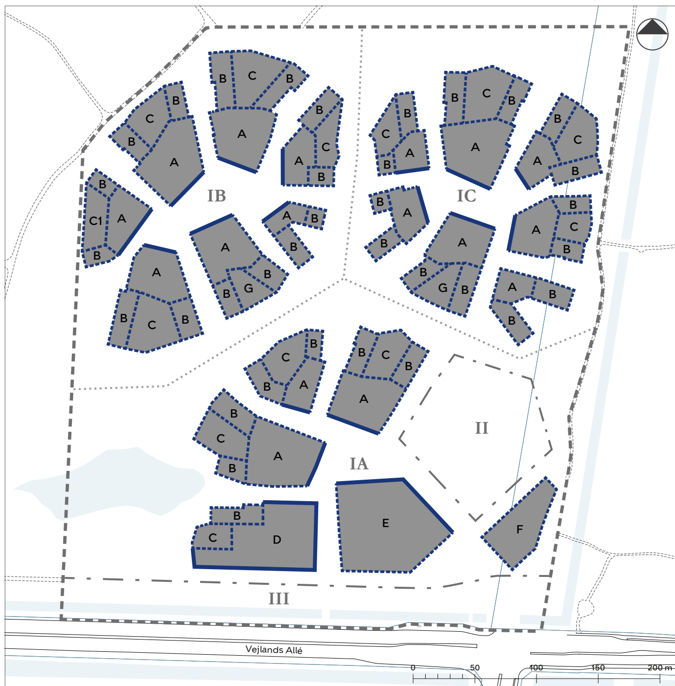
Tegning 4a · Bebyggelsens omfang og placering (ny tegning til bekendtgørelse)

— Afgrænsning af byggefelt, hvor bygning skal følge kant