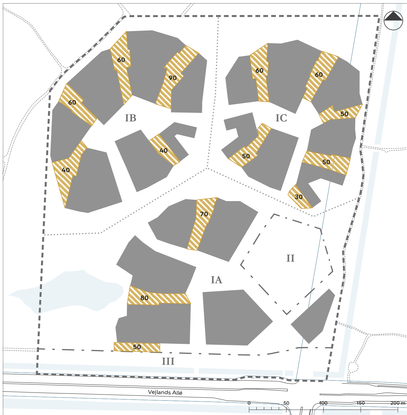
Tegning 4 · Cykelparkering (ny tegning til bekendtgørelse)