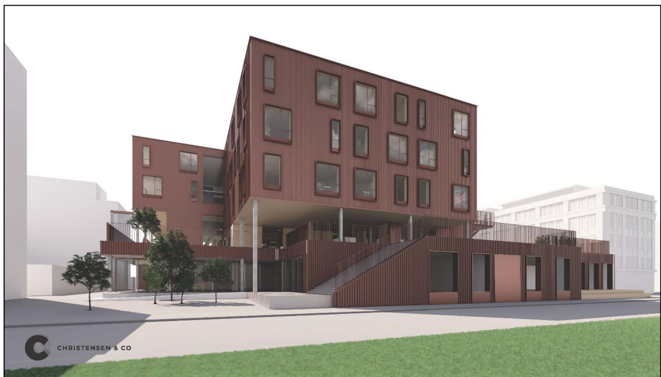
Skoleprojektet set fra nord/Prags Boulevard. Nedkørslen til parkeringskælderen for biler er det lyse felt på facaden nærmest vejen.