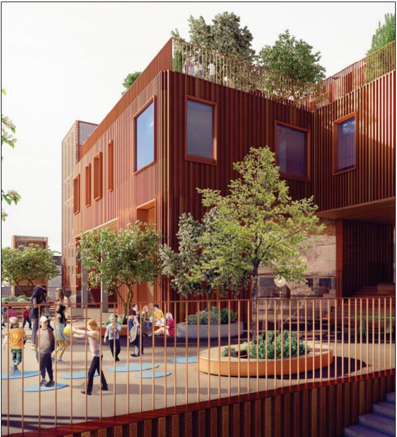
Visualisering af et af skoleprojektets hævede friarealer. Illustration: Christensen og co.