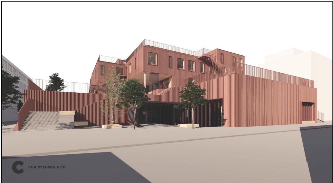
Skoleprojektet set fra syd/Holmbladsgade