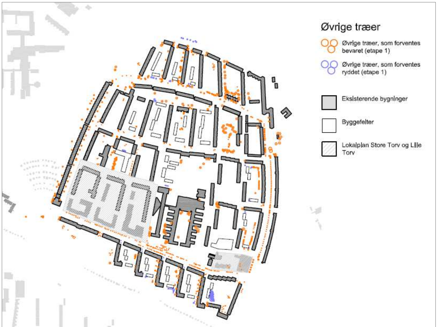
Øvrige træer. Orange markering viser træer som forventes bevaret i etape 1 og blå viser træer som forventes fældet i etape 1. Illustration: SLA