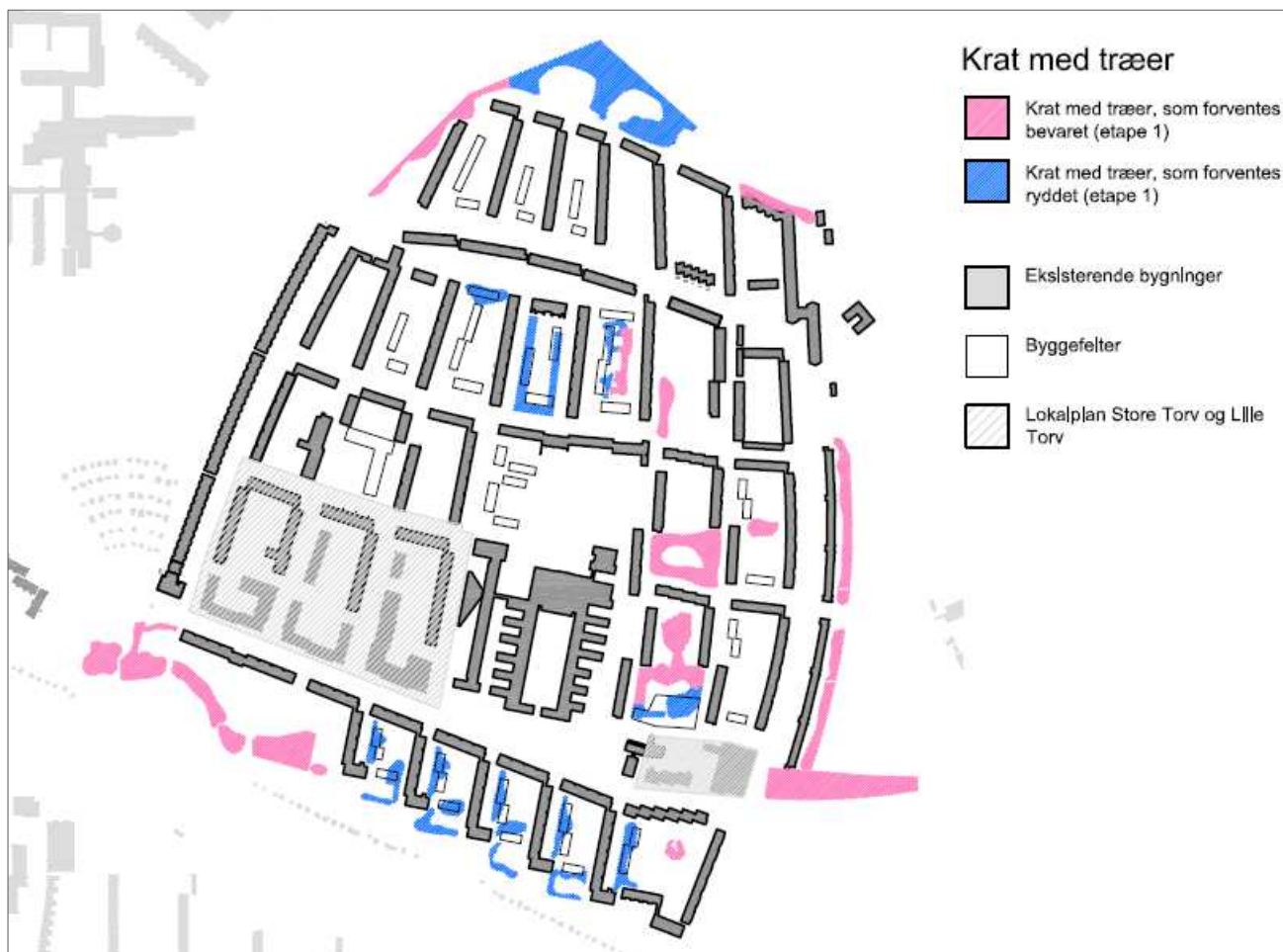
Områder med træer, krat og beplantning. Lyserød markering viser den omtrentlige afgrænsning af områder som forventes bevaret i etape 1 og blå viser den omtrentlige afgrænsning af områder som forventes ryddet i etape 1. Illustration: SLA