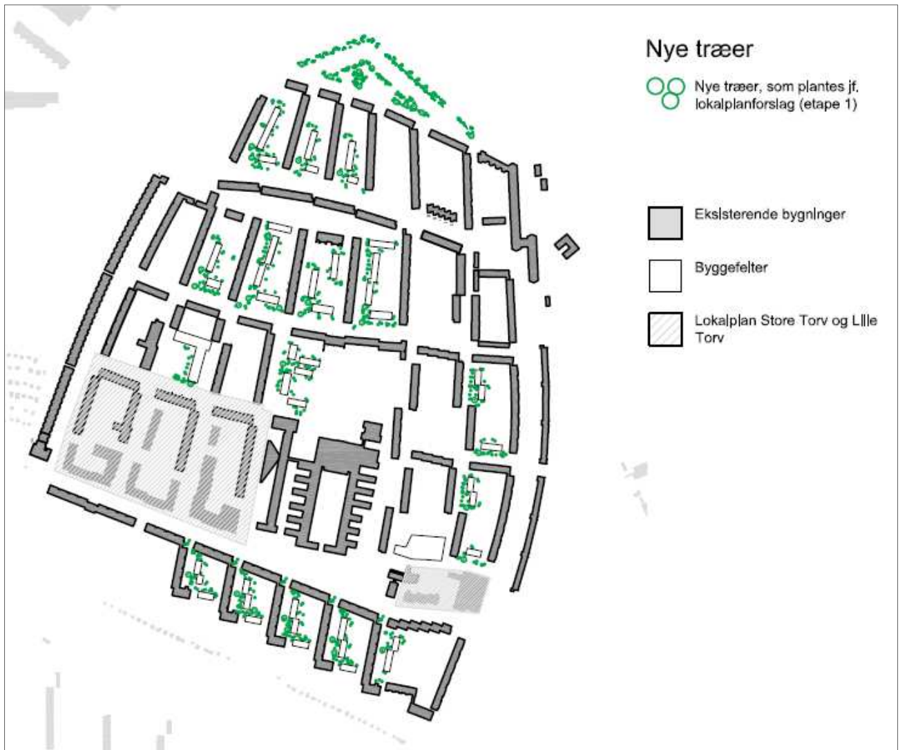
Nye træer, som der stilles krav om i lokalplanens etape 1. Illustration: SLA